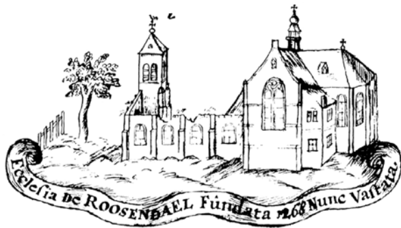
Ecclesia de Roosendaal fundata 1268 nunc vastata door J. Wertz (Collectie Oudheidkundige kring De Ghulden Roos).

rige oorlog: op 31 mei 1572 staken watergeuzen het centrum in brand, op 25 april 1583 en 18 juni datzelfde jaar werd een brand aangestoken door andere rondtrekkende troepen en door een ongeluk in een bierbrouwerij in 1600 ontstond er weer een brand. Bij een van deze branden raakten ook de Sint Jan en de pastorie, waar nu het Tongerlohuys gevestigd is, ernstig beschadigd. Toen er eindelijk vrede werd gesloten was de Sint Jan een ruïne, alleen de toren. Zijbeuken en koor stonden er nog maar het middenschip was helemaal kapot. Een tekening van de Sint Jan van J. Wertz uit 1938, gebaseerd op een tekening van pastoor G. Callebout uit 1696 geeft een idee van hoe de vervallen Sint Jan er toentertijd uit heeft gezien. De tekening draagt dan ook de titel 'Ecclesia de Roosendaal fundata 1268 nunc vastata', ofwel: Kerk van Roosendaal, gesticht in 1268, nu verwoest'.