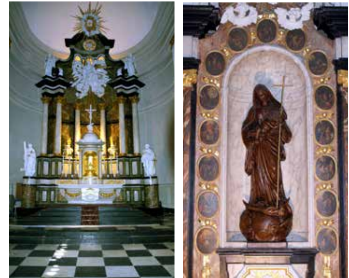
Links: Hoofdaltaar van de Sint Jan Rechts: Zijaltaar gewijd aan Maria

het altaar staan beelden van de apostelen Petrus en Paulus. Deze hoorden eerst bij de preekstoel maar zijn in de jaren zestig bij een grote restauratie witgeschilderd en naast het hoofdaltaar geplaatst. Het altaar lijkt van marmer maar is in feite zeer kundig beschilderd hout.