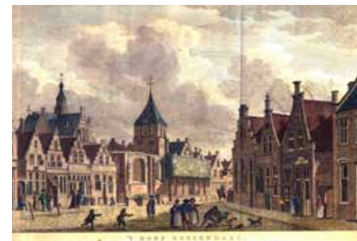
Bloemenmarkt gezien naar de Markt in 1791. Links is de ruïne van het schip (met torentje) van de Sint-Janskerk en de kerktoren te zien (vervaardigd door Carel Frederik Bendorp).

Ondertussen kon de kleine protestantse gemeenschap de grote kerk niet onderhouden waardoor deze in verval raakte. Er werden wel plannen gemaakt om de Sint Jan te restaureren. Dit weten we dankzij een aantal tekeningen van architect Philips Willem Schonck die zijn bewaard in het gemeentearchief. Afgaande op de tekeningen werden er drie mogelijkheden overwogen. De eerste was het afbreken van de toren en het afgebrande deel van de kerk, welke daarna opnieuw opgebouwd zouden worden. Deze optie zou 43.300 gulden bedragen. Tweede optie was het afbreken en opnieuw bouwen van de kerk en het repareren en verhogen van de toren, voor een bedrag van 17.320 gulden. Laatste optie was het afbreken van de kapellen met het afgebrande deel van de kerk, repareren van de toren en het timmeren van een nieuw stuk kerk tegen de toren aan, voor een bedrag van 20.860 gulden. Uiteindelijk werd geen van de opties uitgevoerd en bleef de Sint Jan in slechte staat.