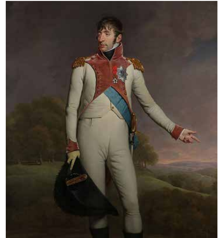
Portret van Lodewijk Napoleon door Charles Howard Hodges in 1809 (Foto WikimediaCommons, collectie Rijksmuseum).