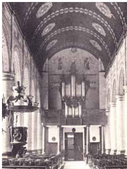
Het interieur van de Lambertuskerk gezien richting de toren. Onder de toren stond het orgel en was de koorzolder. Hier is duidelijk het tongewelf te zien dat door Pierre Cuypers in de kerk was aangebracht.