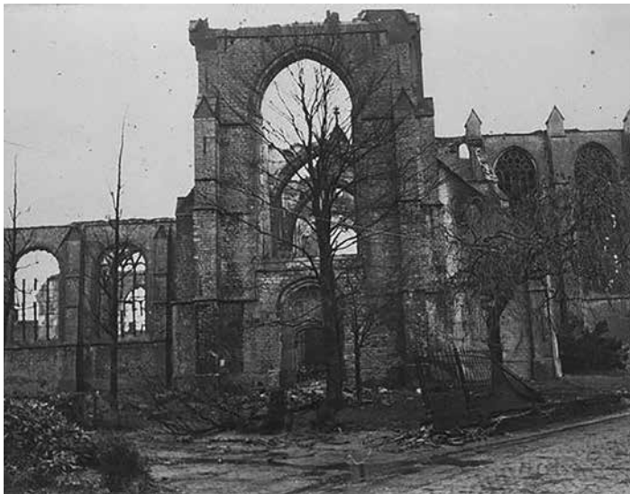
De restanten van de kerk gezien vanuit de Bergestraat. Rechts staan de muren van het priesterkoor nog overeind, maar het dak is verbrand net als de koorbanken die in het priesterkoor stonden

1590 Toen twee jaar later het Wouwse kasteel werd belegerd door het Staatse leger onder leiding van de Franse maarschalk Biron bleek het dorp compleet verlaten. Pas na 1590 keerde de bevolking terug en in 1593 werden er weer diensten door een pastoor in de sacristie gedaan. Van een volledig herstel van het kerkgebouw was nog lang geen sprake. Dat zou er ook niet van komen, want bij de Vrede van Munster moesten de katholieken de Lambertuskerk ontruimen en ging de kerk naar het handvol hervormden dat Wouw telde. De roomse meerderheid moest samen met de Abdij van Bornhem wel het onderhoud blijven betalen.