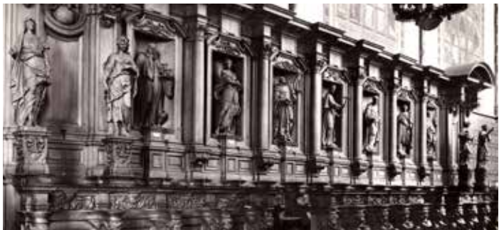
Het koorgestoelte in de vooroorlogse kerk. De beelden werden tijdens de bevrijding verborgen in een kuil met stro en bleven behouden. Het koorgestoelte zelf verbrandde tijdens de bevrijdingsacties. (Collectie De Vierschaer-Wouw)

Van drie Vlaamse kunstenaars is bekend, dat ze aan de koorbanken en de twintig beelden hebben gewerkt. Naast de koorbanken sneden ze ook acht vrouwenbeelden van de verschillende deugden. Beeldhouwer Aart (Artus) Quellinus de Jonge werd in 1625 in Sint-Truiden geboren