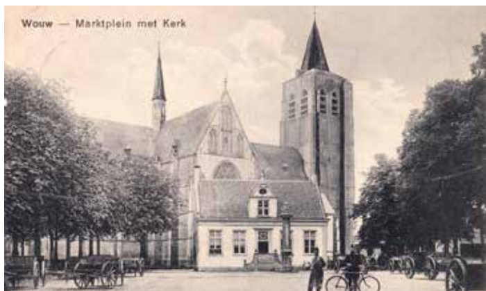
De Lambertuskerk rond 1917. Het ranke vieringtorentje en het doorlopende dak op het middenschip zijn de kenmerken van de vooroorlogse kerk