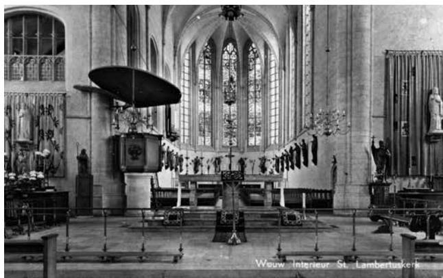
Na de herbouw van de kerk, zag het interieur er heel anders uit. De koorbanken waren verdwenen, maar de beelden kregen een prominente plaats in het priesterkoor. Hier zijn nog de preekstoel, de communiebanken en de beide zijaltaren te zien