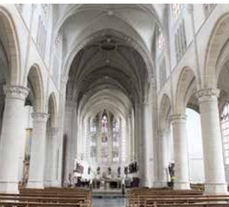
Het interieur van de Lambertuskerk in 2020. Tussen de pilaren rechts is nog een deel van het nieuwe orgel te zien.

Schijven, Frank. De herbouw van de Sint Lambertuskerk. Vier delen in De Vierschaer (1988, 1989 en 1990)