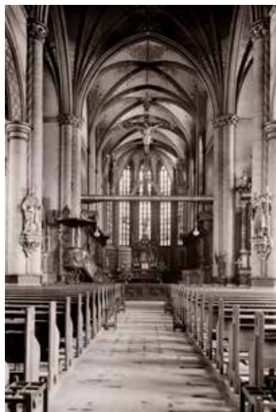
Het interieur van de Lambertuskerk voor de Tweede Wereldoorlog. Met in het priesterkoor de koorbanken met de beelden. De bidstoelen waren toen al vervangen door banken.