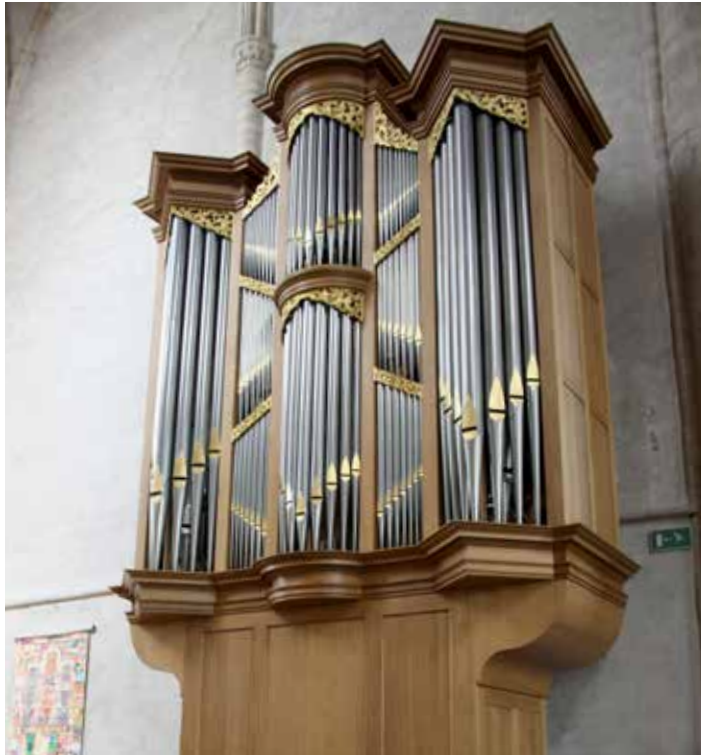
Het Verschuierenorgel in de Lambertuskerk betekende destijds een aanwinst. Regelmatig worden er ook nu nog orgelconcerten verzorgd door de Stichting Orgelfonds Wouw.

Begin 1984 werd het nieuwe orgel, met als werknummer 'Opus 1000', geplaatst en op 6 mei van dat jaar vond de inauguratie plaats. Vanaf dat moment zorgt het Orgelfonds regelmatig voor concerten in de Lambertuskerk.