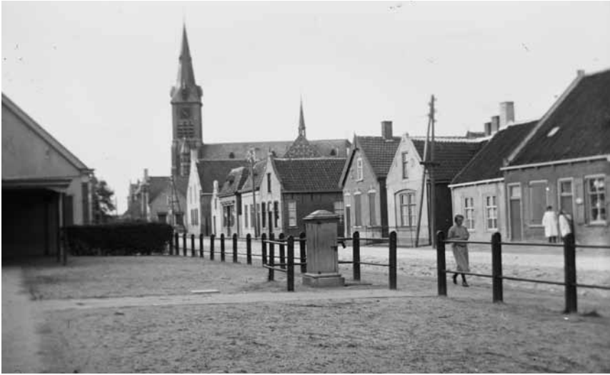
Vanaf het plein van de Kruislandse school had men in de eerste decennia van de vorige eeuw dit uitzicht op de Sint Georgiuskerk.

bezorgdheid voor het gezin en het behoeden van de kroost voor het kwaad. Vooral zijn moeder bad veel in de rotsvaste overtuiging dat met bidden alles verkregen kan worden, ook de aanvaarding van wat niet verhoord werd. Blijkbaar was zij daarbij doordrongen van datgene wat zo vaak van de kansel verkondigd werd: wie bidt wordt zalig, wie niet bidt gaat verloren!