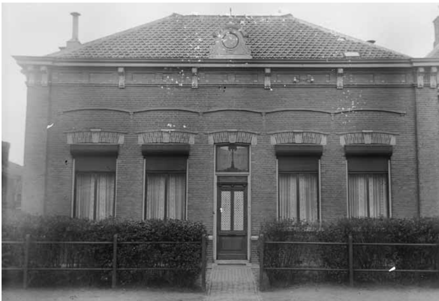
De woning van het hoofd van de openbare lagere school te Kruisland omstreeks 1900.