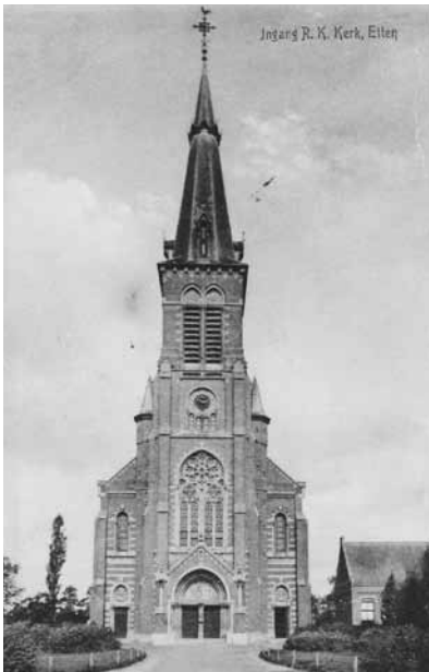
Zo keek en ging men in Etten naar de Sint Lambertuskerk, voordat het H. Hartbeeld in 1926 geplaatst werd.

Ofschoon ietwat minder was Etten-Leur op 1 januari 1971 nog duidelijk één katholieke gemeenschap. Zoals in de hele samenleving speelden onderhuids echter reeds andere mechanismen. In 1957 gaf de deken van Etten opdracht aan het Katholiek-Sociaal Kerkelijk Instituut in Den Haag onderzoek te doen naar het misbezoek op zondag. Eén van de conclusies was dat met het wegvallen van de gesloten en meer traditionele gemeenschap in de arbeidersklasse de druk weggenomen was regelmatig de zondagsplicht te vervullen. Reeds toen waren de eerste scheuren in het hechte katholieke bolwerk te ontwaren en diende de ontkerkelijking zich aan. Velen waren in naam nog wel katholiek maar amper of niet meer praktiserend. 10