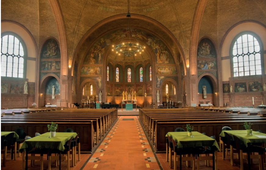
Interieur van de Sint Josephkerk, 2017.

Deze koepel is de tweede reden waarom de Sint Josephkerk speciaal is. Koepelbouw werd niet bepaald vaak toegepast in West-Brabant, het werkterrein van kerkbouwer Hurks. Op de Sint-Laurentiuskerk in Dongen na, is de Sint-Josephkerk de eerste kerk die in deze periode in deze streek gebouwd is als koepelkerk. Landelijk vond deze stijl wel navolging; J.Th.J (Joseph) Cuypers (1861–1949) en J. (Jan) Stuyt (1868–1934) waren twee vooraanstaande architecten die in Nederland dit type kerk bouwden. 5 De koepelkerk was een antwoord op de vraag hoe kerkbouw na 1900 beter op de tijdsgeest kon worden aangepast. Architecten begonnen na de eeuwwisseling te experimenteren en zochten naar een nieuwe vorm van kerkbouw. Onder invloed van de zogenaamde Liturgische Beweging 6 namelijk wilde men de gelovige meer bij de eredienst betrekken. Dit vroeg een ander, kleinschaliger kerktype, waar in het interieur iedereen vrij zicht had op het altaar. De neogotische kerken die in de negentiende eeuw gebouwd werden, waren te groot, massaal en plomp om iedereen de priester te laten volgen in zijn handelen. De kleinere, centralistische koepelkerk garandeerde een vrij zicht op het altaar.