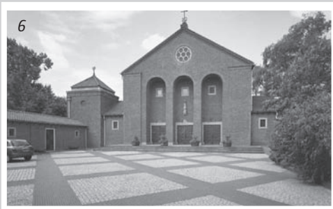
1. Sint Josephkerk aan de Sint Josephstraat 4 te Roosendaal ontworpen in 1923, foto 1933. (Rijksdienst voor het Cultureel Erfgoed, Objectnummer SP-0656)