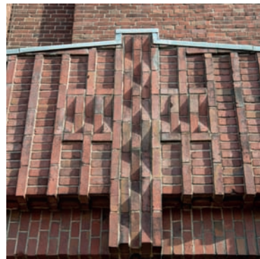
Detail van de Josephkerk, 2017.

Kortom: Hurks toonde zich met de Sint-Josephkerk een vernieuwer in de katholieke kerkbouw. Niet alleen de toepassing van de nieuwe liturgische eisen in een koepelkerk was een relatieve noviteit in de streek, ook het veelvoud aan invloeden die de kerk kent, waarbij historiserende stijlen gemengd worden met eigentijdse vormen, was nieuw. De experimentele zin die architecten vanaf de jaren twintig aan de dag legden, vertaalde zich in Hurks' kerkbouw in een caleidoscopisch, doch samenhangend geheel.