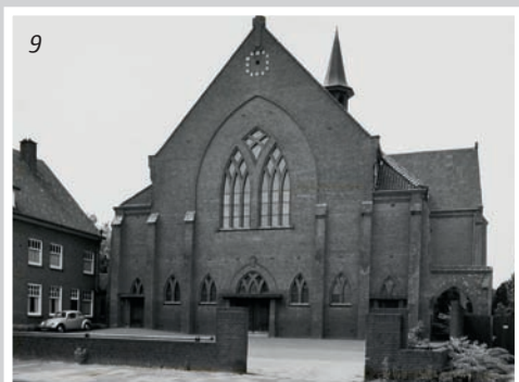
8. Kerk van de Heilige Jacobus de Meerdere aan de Molenstraat 26 te Fijnaart, ontworpen in 1955, foto 2017.