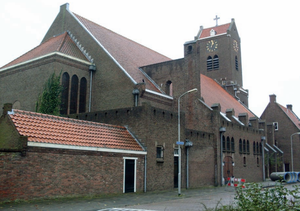
De Onze-Lieve-Vrouw van Goede Raadkerk naar ontwerp uit 1914 van Kropholler in Beverwijk, 2010. (Wikipedia foto Marcel mulder Licentie: CC-BY-SA-3.0-NL)