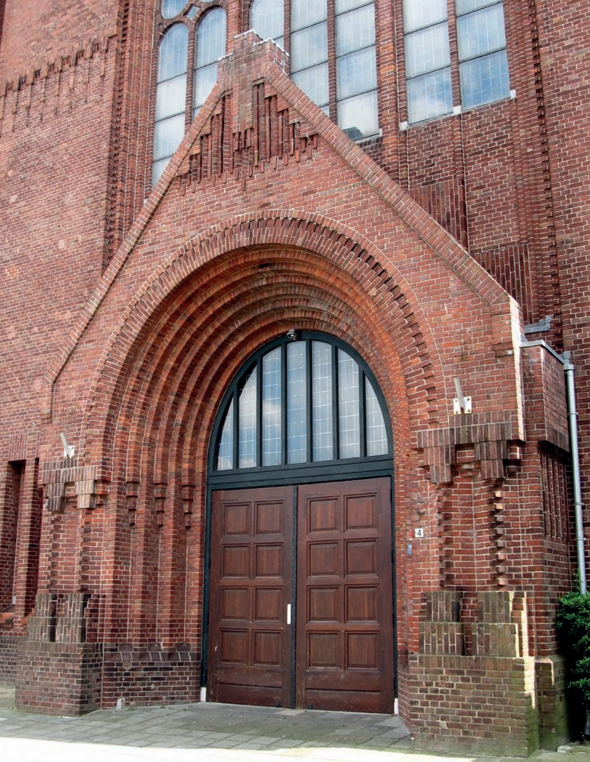
De wimberg of het frontaal van de Sint Josephkerk van Hurks, 2014.