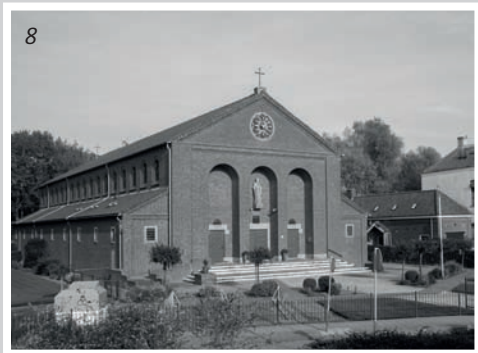
6. Kerk van de Heilige Dionysius aan de Antwerpsestraat 35 te Putte, ontworpen in 1953. (Rijksdienst voor het Cultureel Erfgoed nr. 338164)