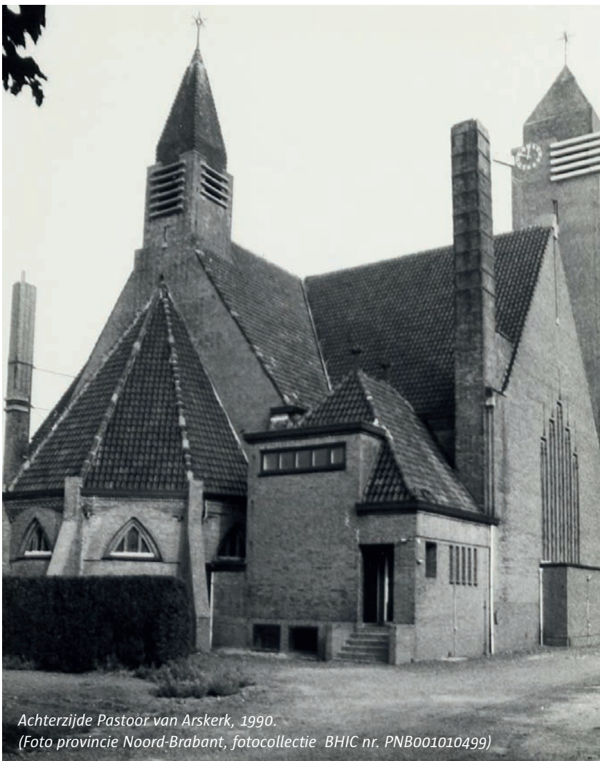
Achterzijde Pastoor van Arskerk, 1990.