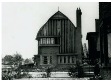
Ludwigstraat 1. (WBA roo 410,