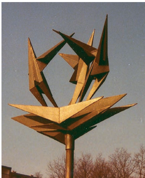
Beeld 'Uitvliegende vogels' door Kees Keijzer bij Azaleastraat 1 in 1975, nu in de tuin van het Tongerlohuys.