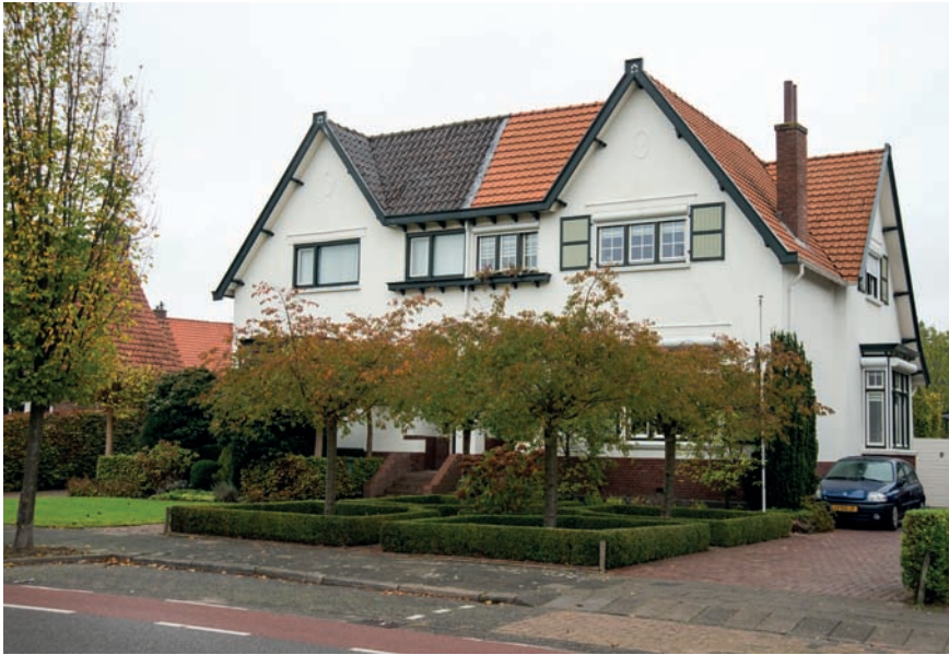
Nispensestraat 81-83, 2017.

84 was in Nederland. De serre had hij open getekend, als een veranda. Dat ontwerp heeft hij later aangepast door er glas in te plaatsten. Verder was het huis zo eenvoudig mogelijk gebouwd, vanwege de tekorten aan bouwmaterialen in die tijd. Aan het huis werd daarom niet meer besteed dan nodig was om het als modelwoning te presenteren. Toch had de architect erg zijn best gedaan kwaliteit en luxe te suggereren. Zo was het trapje naar de voordeur er zuiver om aanzien te wekken. Dat had niets te maken met eventueel te verwachten wateroverlast, want dan hadden andere huizen in de omgeving ook een verhoogde ingang moeten hebben. Ook de royale voortuin en de wit gestuukte gevels moesten bijdragen aan een mooie presentatie. Van die gevels zijn