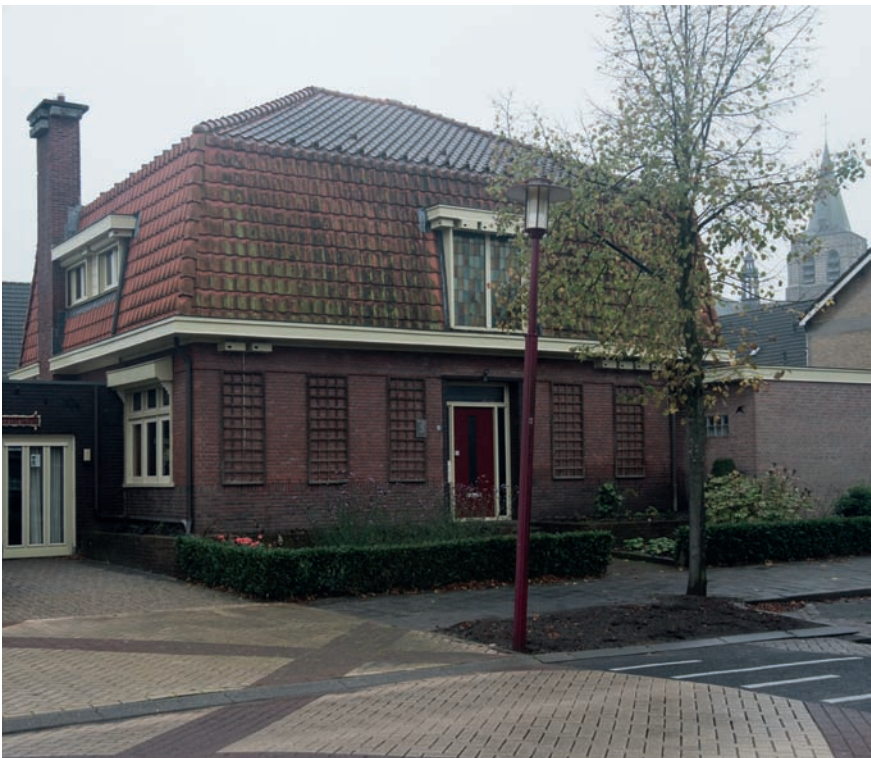
Omgang 10, 2017.