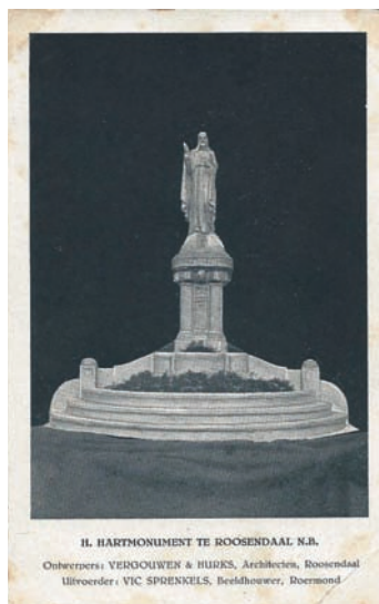
IL. HARTMONUMENT TE ROOSENDAAL N.B. Ontwerpers: VERGOUVEN & HURKS, Architecten, Roosendaal Uitvoerder: VIC SPRIJKELS, Bestuurder, Doornmond

In 1921 wordt naast de Sint Janskerk het Heilig Hartbeeld geplaatst, naar een ontwerp van Vergouwen & Hurks. Aanvankelijk in het plantsoen naast de Sint Jan, met het gezicht naar de Markt. Later wordt dat beeld verplaatst naar de achterzijde van de kerk, met het gezicht richting Tongerloplein. Als het Tongerloplein gemoderniseerd wordt, wordt het beeld op een sokkel bij de Heilig Hartkerk geplaatst. De oorspronkelijke hardstenen voet met tree raakt dan vermoedelijk verloren.