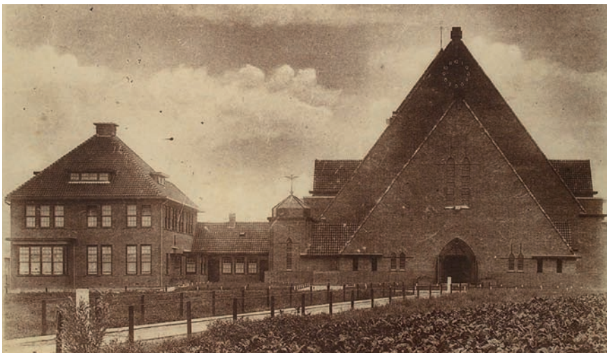
Maria Middelaars van Alle Genadekerk en pastorie in Breda, 1934.

wand dichtgemaakt. Nu is dat nog het enige huis van Hurks met een gedeeltelijk houten gevel. Voor zover ik weet heeft Hurks niet meer dan drie panden met houten gevels gebouwd; dit huis in Rucphen, de stal (1928) van de Gerdahoeve in Schijf en Ludwigstraat 1 (1926) in Roosendaal. Nadat dat laatste pand in de oorlog verwoest is, is die houten gevel vervangen door metselwerk.