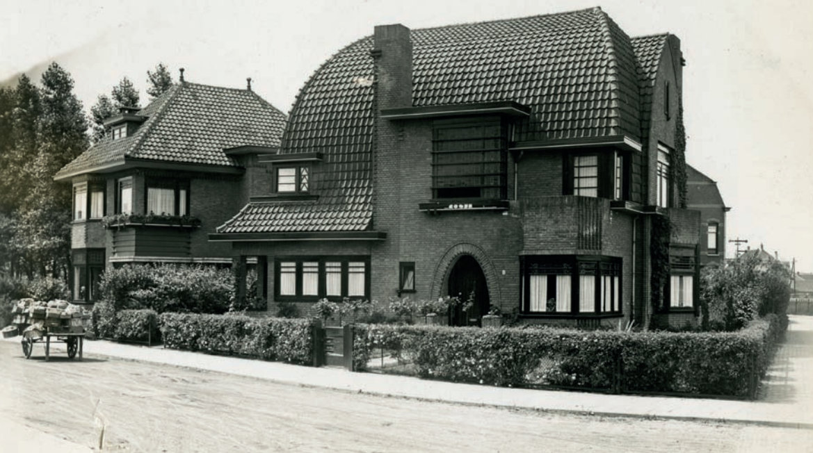
Ludwigstraat 2, c. 1935.