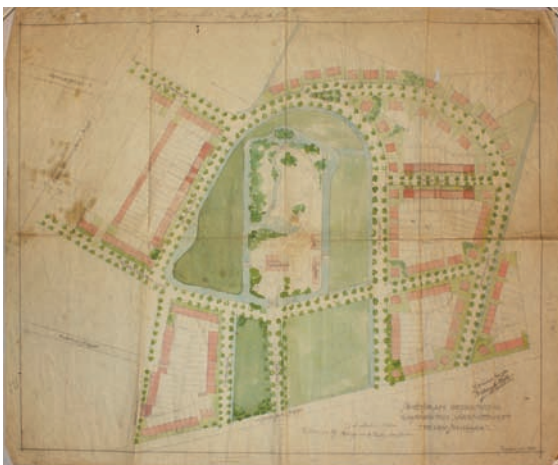
Schetsplan voor een mogelijke bebouwing van landgoed Vrouwenhof, schaal 1:1.000. Ontwerp van een niet uitgevoerde bebouwings- en stratenplan (met de namen Kastanjelaan, Vijverlaan, Roosendaalschelaan, Middenlaan, Lindelaan), door architecten Vergouwen en Hurks, 1920. (WBA, Tekeningencollectie Roosendaal en Nispen nr. T 00245)

Omstreeks 1920 gaat de architect een compagnonschap aan met Vergouwen. Samen bouwen ze een aantal huizen, onder andere voor Goyarts Zaadhandel aan de Brugstraat 35 (1921), het pand waar later de muziekschool in komt en waar tegenwoordig een notaris kantoor gevestigd is. Kort daarna krijgen ze ook de opdracht voor de bouw van de Sint Josephkerk (1924).