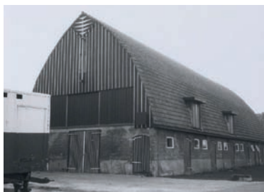
De stal (1928) van de Gerdahoeve in Schijf, 1990.