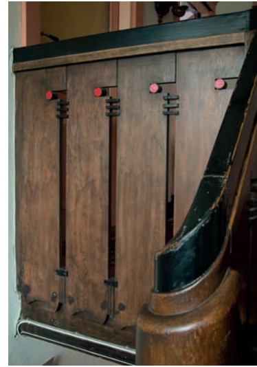
Detail trappenhuis, 2017.