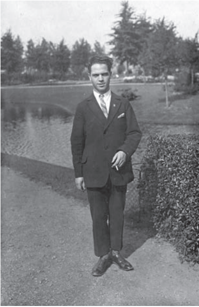
Cees Meeuwis in zijn jeugd.