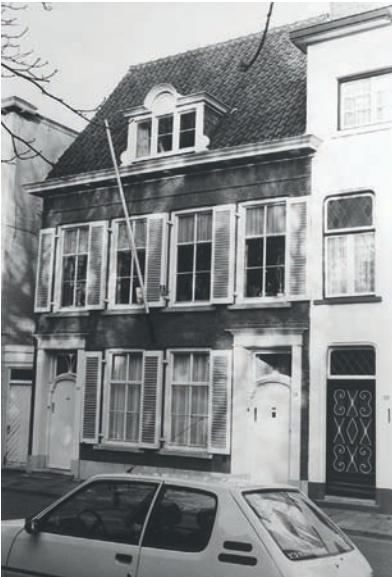
Vughtstraat 24 in 1989