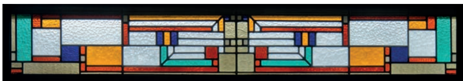
Detail glas-in-lood, 2017.

In 1931 tekende architect Hurks, in opdracht van notaris Siebelink, twee huizen in Wouw; een woonhuis met kantoor aan de Markt en een herenboerderij, die bereikbaar was via de Kroonse Gang naast hotel “De Kroon”. Tegenwoordig is het adres daarvan Omgang 10.