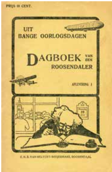
Titelpagina van het gedrukte dagboek, 1915.