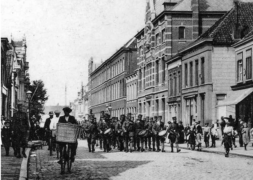
Een regelmatig terugkerend beeld in Roosendaal tijdens de Eerste Wereldoorlog. Voorafgegaan door een muziekkorps marcheren soldaten door de straten (hier de Molenstraat), 1917.