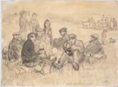
'Belgische Vluchtelingen rustend Leo Gestel oorlog 1914'.

Toen de enorme stroom Belgische vluchtelingen naar Nederland op gang kwam trok de in Amsterdam woonachtige kunstenaar Leo Gestel (geboren als Leendert, Woerden 1881-Hilversum 1941) naar de Nederlands-Belgische grens om tekeningen te maken van hetgeen hij daar zag gebeuren. Hij maakte meer dan honderd realistische en expressieve tekeningen in potlood, krijt en houtskool, waarbij zijn kleurgebruik als donker en aards gekenschetst kan worden. De tekeningen verkocht hij ten bate van de vluchtelingen.