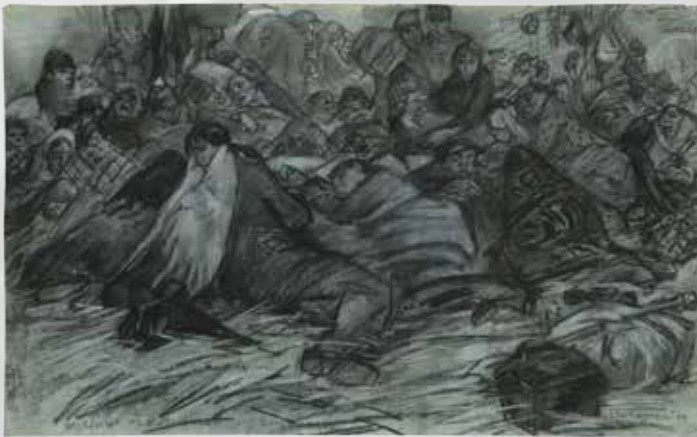
'Belgische vluchtelingen Roosendaal, Leo Gestel '14'. (Collectie Stedelijk Museum Alkmaar)