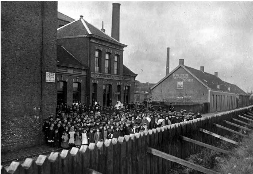
Belgische vluchtelingen voor het gebouw van de Java, waarin een opvangcentrum werd ingericht, 1914.