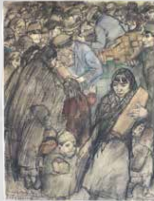
'Brooduitdeeling aan vluchtelingen Roosendaal '14'.