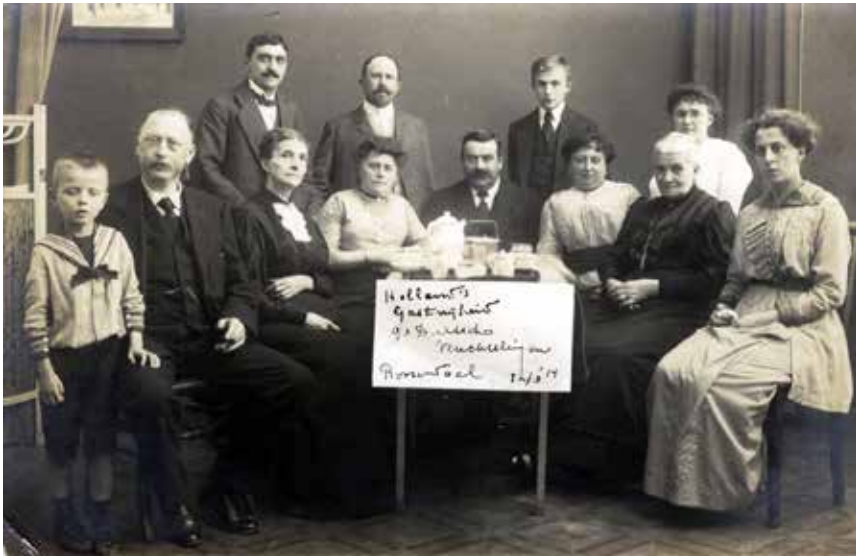
Duitse vluchtelingen uit België in Roosendaal danken de Nederlanders voor hun gastvrijheid, 12 augustus 1914. (Fotocollectie Heemkundekring De Vrijheijt van Rosendale)

‘overmoedig en brutaal’, ‘Moffen’ en ‘de leelijke Pruis’ kwalificeerde? Velen van hen voelden zich in Roosendaal op hun gemak en op zondag zaten bij Hotel Neerlandia de dames te haken of te borduren, terwijl de heren ‘met hun meestal dikke buikjes’ de Europese toestanden bespraken. Ook de cafés en koffiehuzen zaten vol en overal was Duits te horen.