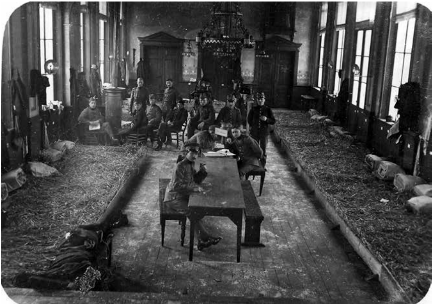
Gemobiliseerde soldaten in hun dagverblijf en slaapzaal in het broederklooster Ste Marie te Roosendaal. Langs de muren de met stro gevulde britsen, maart 1915. (Fotocollectie gemeentearchief Roosendaal)

Dinsdag 11 augustus heerste er onrust in Roosendaal. Al om acht uur liepen er mensen naar de Markt. Er was iets aangeplakt op het raadhuis. De staat van oorlog was afgekondigd voor de provincies Zeeland, Noord-Brabant, Limburg en Gelderland. Omdat eigenlijk niemand precies wist wat de staat van oorlog exact inhield - 'de eene vertelt dit,