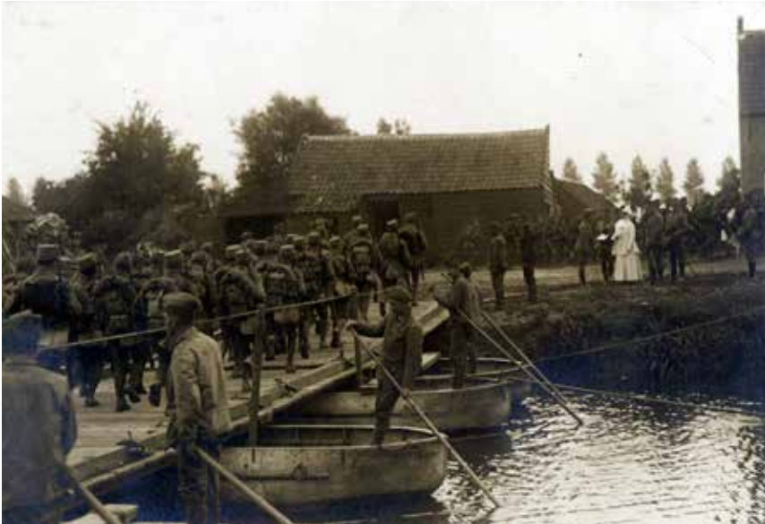
Koningin Wilhelmina (in het wit) bracht regelmatig inspectiebezoeken aan het leger in Noord-Brabant. Hier bekijkt zij het gebruik van een pontonbrug over de Vliet, juli 1915.