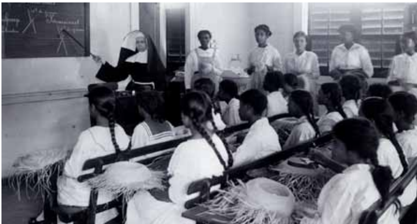
Theoretisch onderwijs op de vlechtschool in Paramaribo, circa 1930.