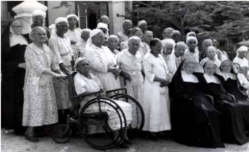
Ouderenzorg in Welgelegen op Curaçao, 1918.

Naast onderwijs gaan steeds meer zusters in de wijkverpleging en het ziekenhuis werken. In 1915 wordt in het St. Josephgesticht te Roosendaal een sanatorium ingericht. 166 Ook vertrekken steeds vaker zusters naar de missiegebieden om te gaan werken in de ziekenverpleging. In de Tweede Wereldoorlog, wanneer de religieuze leerkrachten 40 procent op hun salarissen worden gekort, biedt de exploitatie van ziekenhuizen compensatie voor de verminderde inkomsten. In oktober 1940 wordt in Groesbeek een pension geopend waar bejaarden worden verzorgd. 'Dit pension vormt nu een noodzakelijke