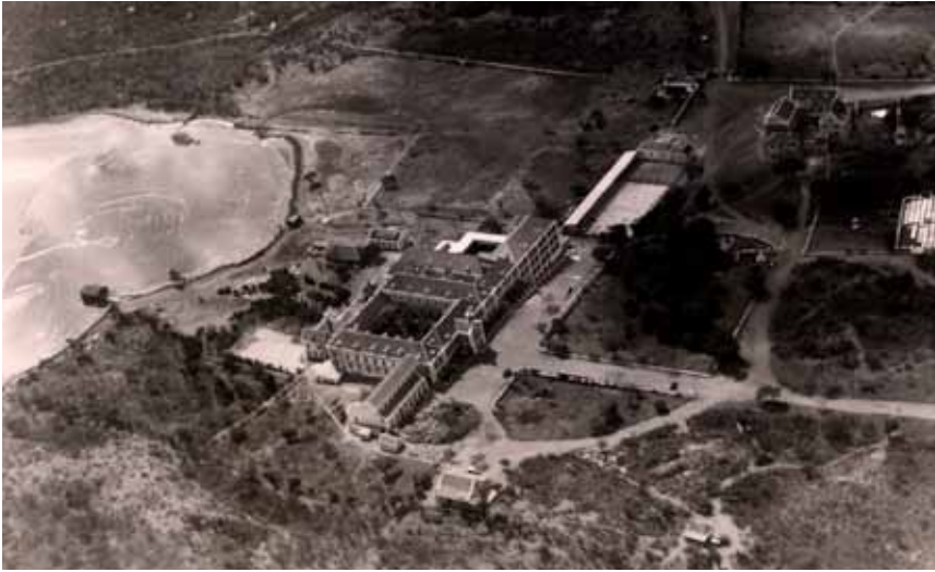
Vestiging Welgelegen op Curaçao, circa 1935.