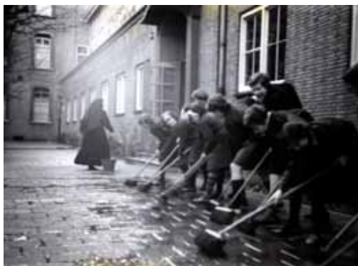
Kinderen aan het schrobben op Cour I waarschijnlijk ten behoeve van een actie voor Zuid-Amerika, circa 1958.