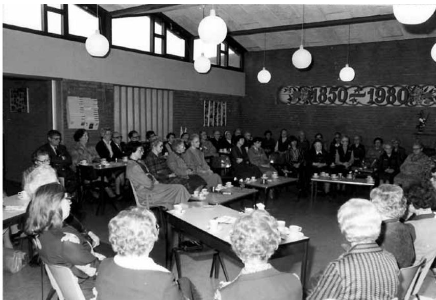
Afscheidsbijeenkomst in de aula van basisschool De Stappen in Wouw van de Zusters Franciscanessen die van 1850 tot 1980 het onderwijs hebben verzorgd, 7 maart 1981.

het werk dat de afgelopen maanden is verzet, en kan - ondanks de pijn, die het afstoten van scholen met zich meebrengt - toch tot genoeg meedelen, dat de overgedragen scholen weer met deskundigheid en zorg worden bestuurd. 22 Op 24 juni 1986 wordt de Stichting ontbonden 'wegens het niet meer in beheer en bestuur hebben van scholen.' 23 Een tijdperk is voorgoed afgesloten.