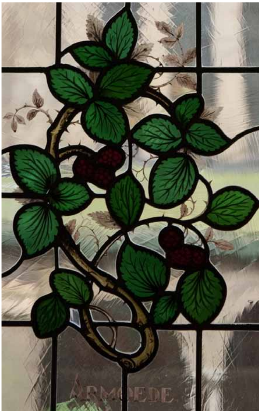
Gebrandschilderd glas-in-loodraam in de spreekkamergang van Mariadal.