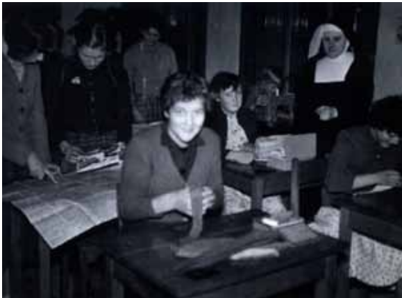
Naaischool, circa 1955.