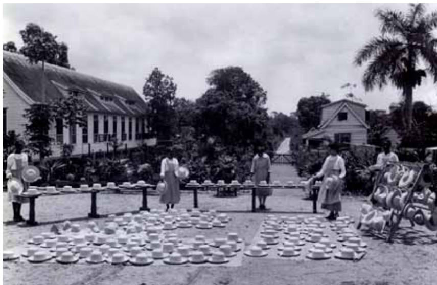
Zonnen van de hoeden op de vlechtschool in Paramaribo, circa 1930.

gen door de omstandigheden, de subsidie. Desondanks wil men 'dit prachtige sociale werk, waardoor zoveel meisjes van zedelijke ondergang bewaard worden, niet opgeven.' 135 Alle werkzaamheden die geld opleveren, worden aangepakt zoals het inpakken van groente en fruit voor de export en het inrichten van een naaiatelier.