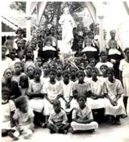
Schoolkinderen op Curaçao, circa 1920.

Deze situatie is deels te wijten aan het niet gelijkgesteld zijn van het onderwijs zoals dat in Nederland sinds 1920 is gebeurd. In 1921 wordt