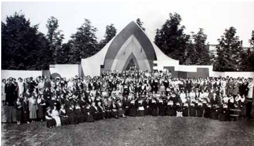
Viering van het eeuwfeest van de congregatie in 1932.

Er is een aantal vestigingen dat, in vergelijking tot andere, een korter bestaan heeft gekend. Zo worden het pensionaat te Montfoort en de lagere school te Aardenburg, beide gesticht in 1842, respectievelijk in 1887 en 1877 opgeheven of overgedragen aan andere stichtingen. De lagere school en het weeshuis in Steenberg en staan onder bewind van de zusters van 1845 tot 1867. In Hillegom en Rotterdam stranden de pogingen om een lagere school te stichten al in het eerste jaar, respectievelijk in 1856 en 1870. Den Haag heeft op verschillende locaties scholen die door de zusters worden bediend maar ook hier moeten de