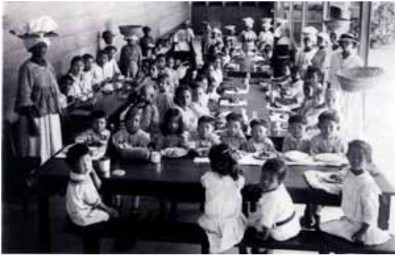
Kinderen genieten een twaalfuurtje in vestiging De Voorzienigheid in Paramaribo, circa 1920.

kenpersoneel zijn zeker heel goede krachten doch niet allen hebben de nodige toewijding. Daarbij is het jammer, dat wij geen invloed op haar vorming hebben, daar de opleidingscursus van de Missie uitgaat. 146 De salarissen van het onderwijzend personeel zijn echter dusdanig laag dat voorstellen tot verbetering van de kwaliteit van het onderwijzend personeel tot de onmogelijkheden behoren. Pas in 1969 wordt het verzoek van de zusters gericht aan de Nederlandse regering voor salaristoeslag voor de in Suriname werkende leerkrachten, gehonoreerd.