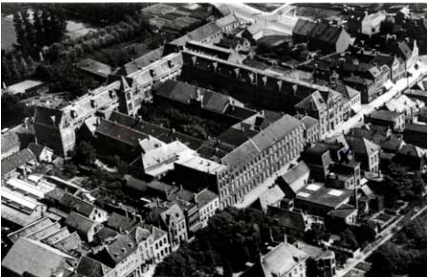
Luchtfoto van het klooster- en scholencomplex tussen Molenstraat en Kloosterstraat te Roosendaal, 1947.

De stichting in Roosendaal wordt het 'Moederhuis' en is de spil van waaruit met grote daad- en slagkracht het doel van Mère Marie Joseph wordt gerealiseerd. Bij haar overlijden op 8 december 1867 telt de congregatie zeventien stichtingen die bestuurd worden door 390 zusters. 27 Alle stichtingen, afdelingen genoemd, die vanuit Roosendaal tot stand komen, blijven weliswaar onder het 'Moederhuis' vallen maar genieten een grote mate van zelfstandigheid zoals hierboven vermeld. Zij beheeren hun eigen financiën en gebouwen. Zij leggen eenmaal per jaar verantwoording af tijdens de algemene ledenvergadering van het Genootschap. Tijdens die vergadering wordt aan alle afdelingen toestemming gevraagd voor ingrijpende beslissingen die de hele congregatie aangaan. Ook tussentijds wordt voeling met elkaar gehouden. De onderlinge solidariteit is groot.