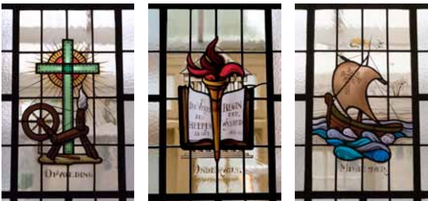
Deze gebrandschilderde glas-in-loodramen in de spreekkamergang geven de maatschappelijke taken van de Zusters van Mariadal weer, van links naar rechts zijn dat opvoeding, onderwijs en missieijver.