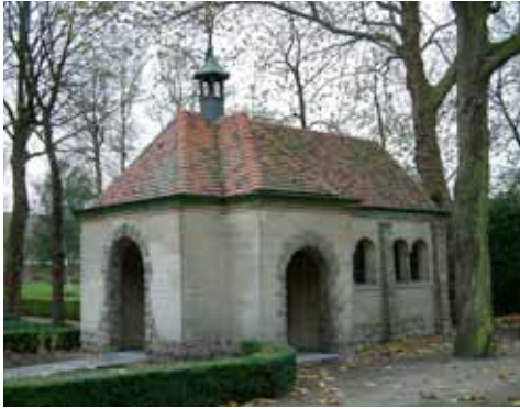
De kapel in de tuin van Mariadal waarin Mère Marie Joseph tot september 2011 begraven lag.