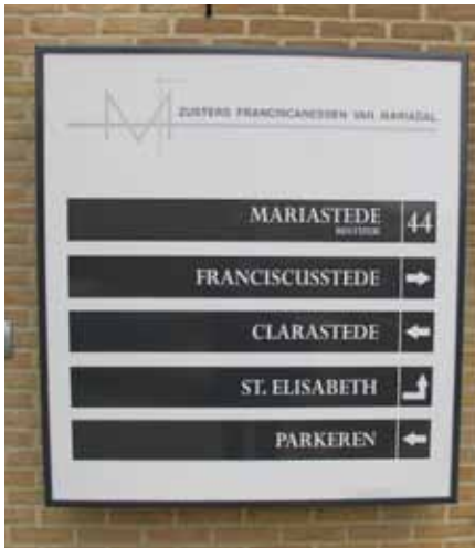
Informatiebord bij het bestuurscentrum Mariastede. (Foto M. Voermans, 2012).