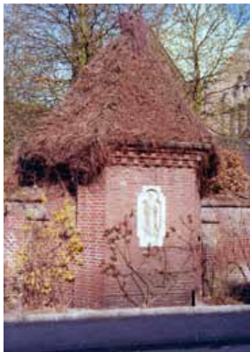
De kapel in de tuinmuur van Mariadal aan de Burgemeester Prinsensingel. Het basreliëf stelt Maria 'Moeder van Smarten' voor, 1975.