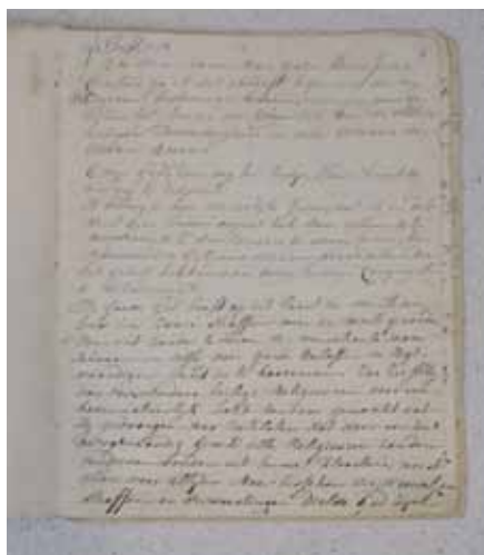
Eerste pagina van de Verlichtingen van Mère Marie Joseph.

Deze ontwikkelingen vereisten aanpassingen binnen het kloosterleven, zodanig dat de geest van de penitenten-recollectinen behouden bleef. Juist hieraan waren de zusters sterk gehecht. Het ging dan vooral om de constituties van pater Marchant. Deze ademden de geest van armoede en afzondering. Bij de penitenten-recollectinen waren alle kloosters zelfstandig. De politieke constellatie maakte de beleving van het kloosterleven eenvoudiger. Koning Willem II stond in 1840 de kloosterlingen toe hun habijt weer te dragen. De penitenten-recollectinen kozen voor de