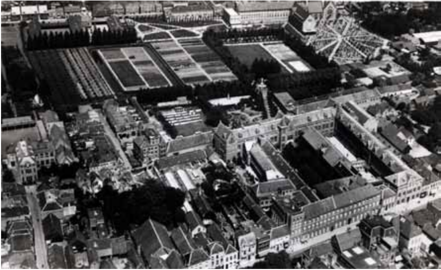
Het complex van klooster- en schoolgebouwen en tuinen tussen Molenstraat en Vincentiusstraat. Aan de bovenzijde is het nieuwe complex Mariadal te zien, 1935.