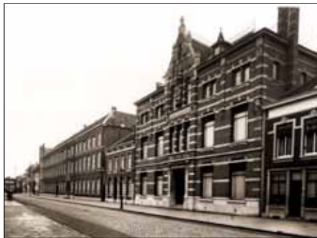
Gevelaanzicht van het kloostercomplex in Molenstraat omstreeks 1930.