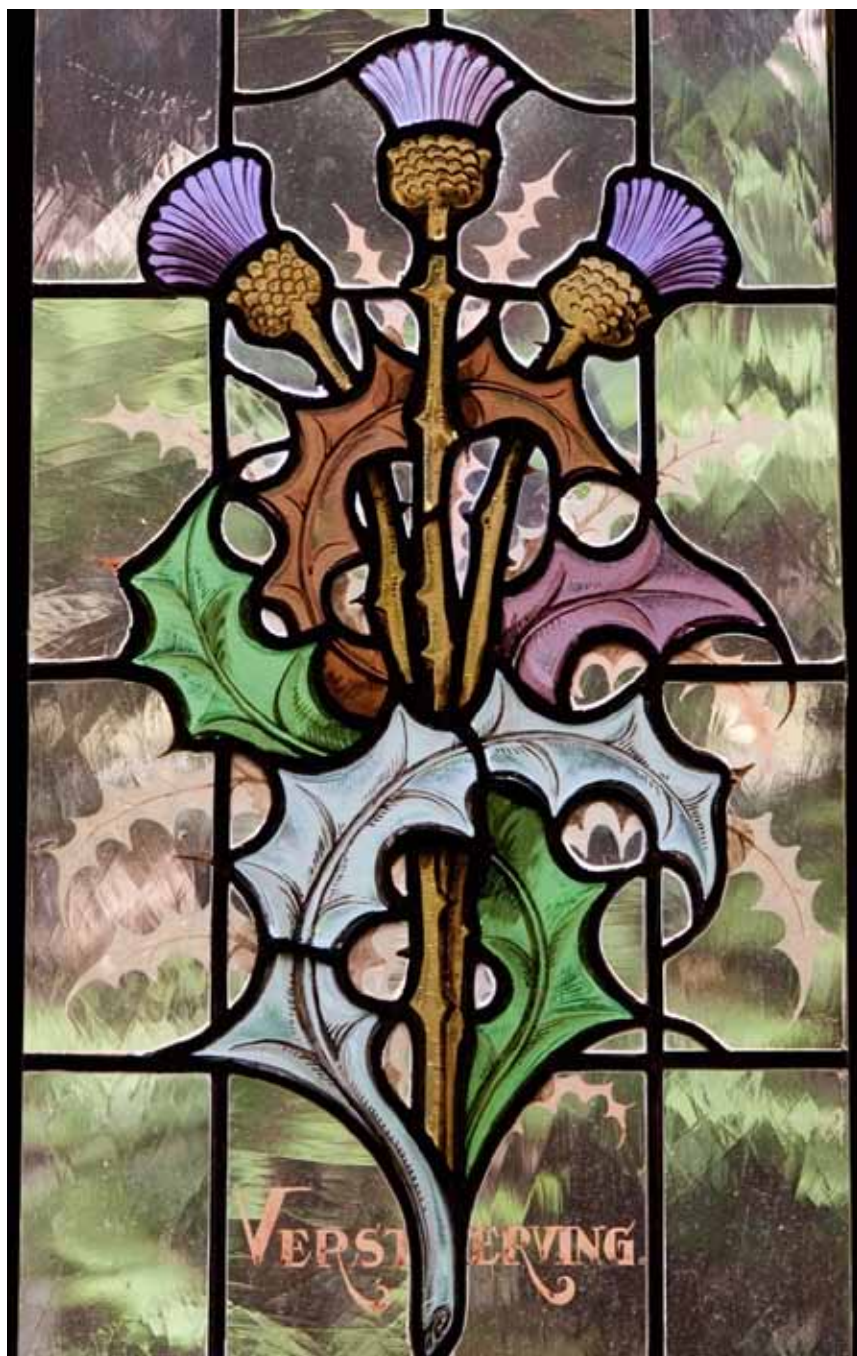
Gebrandschilderd glas-in-loodraam in de spreekkamergang van Mariadal.