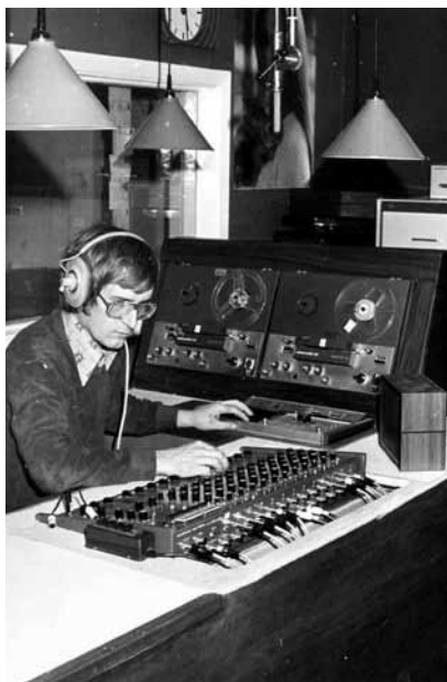
De lokale ziekenomroep Azalea in één van de kelders van het klooster Mariadal, 1975.

Van 1962 tot en met 1965 vond het Tweede Vaticaans Concilie plaats. Op 28 oktober verscheen het decreet Perfectae Caritatis over de aangepaste vernieuwing van het religieuze leven. Volgens de concilievaders omvatte dit tegelijk een voortdurende terugkeer naar de bronnen van ieder christelijk leven en naar de oorspronkelijke inspiratie van de instellingen als de aanpassing daarvan aan de gewijzigde omstandigheden. 36 De bisschoppen formuleerden ook een aantal beginselen voor het welslagen van deze hervormingen. Volgens een van deze beginselen strekt het tot welzijn van de Kerk dat de instellingen hun eigen bijzondere aard en taak bezitten. Daarom moet men de geest en de eigen bedoelingen van de stichters als ook de gezonde tradities getrouw erkennen en handhaven.