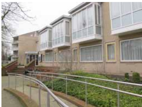
Mariastede, bestuurscentrum van de Zusters Franciscanessen.