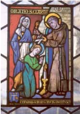
Franciscus van Assisi snijdt de haren van Clara van Assisi bij gelegenheid van haar kloosterintrede. (Glas-in-loodraam in het kapucijnerklooster Maria Hilf te Gubel, Zwitserland)

Door het toetreden van Clara van Assisi (1194-1253) in 1212 ontstond een vrouwelijke tak. Clara van Assisi was een adellijke dame. Zij werd zo geraakt door het getuigenis van Franciscus dat zij zich bij hem aansloot. Bij haar sloten zich jonge vrouwen aan. Ook zij kozen vrijwillig voor een leven van armoede. Kort voor haar dood zette Clara haar levensvorm op papier. Paus Alexander IV bevestigde deze. De door Clara gestichte en naar haar genoemde kloosterorde vormt de tweede orde. De clarissen vormen een zuiver contemplatieve orde.