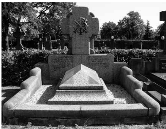
Grafmonument van het echtpaar Van Gilse-van Loon ontworpen door Jos Cuypers.