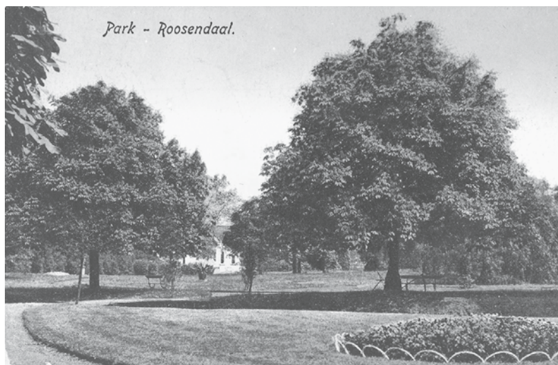
De tuin omstreeks 1900. Duidelijk is het effect te zien van de Engelse landschapstijl met gazons, slingerende paden, perken, vrijstaande bomen en heesterbeplanting. Op de achtergrond de tuinmanswoning aan de Vughtstraat.

brede en nauwe stukken het karakter kregen van een natuurlijke waterloop. Zeker als dit zo geraffineerd werd aangelegd dat begin en eind van de vijver keurig achter een heuveltje of struikgewas schuilgingen. Door de hele tuin werden eveneens slingerende paden aangelegd die grote gazons en beplantingen met bomen en heesters doorsneden. Doordat afgezien van de hoofdas geen enkel pad een rechte loop kende, was een wandeling door dergelijke tuinen voortdurende verrassend, omdat door het slingeren telkens een ander stuk tuin in het gezichtsveld kwam. Dit gegeven werd veelal gecombineerd met het creëren van zichtlijnen door een geraffineerde plaatsing van de heesters, bomen, heuveltjes en prieeltjes. Ook de tuin van Markt 54 werd zo aangelegd dat vanuit verschillende punten achter in de tuin ineens het huis in volle glorie te aanschouwen was. Het mooiste gezicht moet men hebben gehad vanaf de perken voor een tweetal kassen aan de noordzijde van de tuin. Hier keek men vanaf een verhoging over het breedste punt van de vijver en een gazon op de achtergevel van het huis. Overigens stroomde door de tuin ook nog een afwatering die vanouds langs de Molenstraat en de Markt naar de Molenbeek liep. Later werd deze beek geheel overkluisd en verdween uit het straatbeeld.