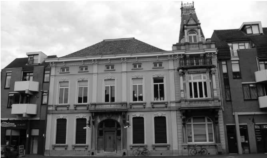
De voorgevel van het gerestaureerde pand Markt 54 met aan weerszijden appartementen en commerciële ruimten van het complex Marktstede. (Foto M. Buijs, 2008)

mezzanino is een soort tussenverdieping met een geringe hoogte en dus ook lagere ramen. Dit is een kenmerkend element uit de baroktijd dat in Nederland vaak onder het dak, boven de hogere ramen van de hoofdverdiepingen werd toegepast. Opvallend is de rijke decoratie die aan de voorzijde is toegepast. De raamomlijstingen zijn aan de bovenzijde voorzien van kuiven met krullen, loofwerk, guirlandes en fruit. De kroonlijst heeft aan de onderzijde een lijst van kleine uitspringende blokjes, een zogeheten tandlijst. De deuromlijsting is aan weerszijden voorzien van ijzeren schoenschrapers, waaraan men de schoenen kon schoonschrapen voordat men het huis binnenging. Voor het huis lag een hardstenen stoep met stoepalen en smeedijzeren kettingen.