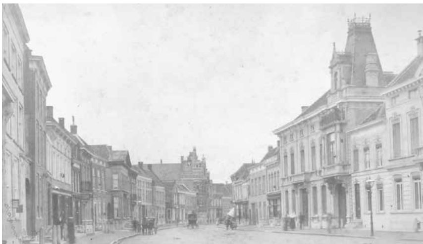
De Markt in westelijke richting circa 1910. Rechts het pand Markt 54 met onder de toren de dubbele koetspoort en voor het huis nog palen met kettingen. Links halverwege de rij het iets naar voren springende pand van de familie Van Weel (Markt 49). Het hoge pand met toren op de achtergrond is de bank van de familie Van Gilse.

De geringe breedte van de uitbreiding maakte dat de kamers daarin smal en diep werden. Architect Vergouwen wist echter optimaal te zorgen voor lichttoetreding door aan de voor- en achterzijde erkers te bouwen. Aan de voorzijde werd de erker uitgebouwd op een balkon, dat