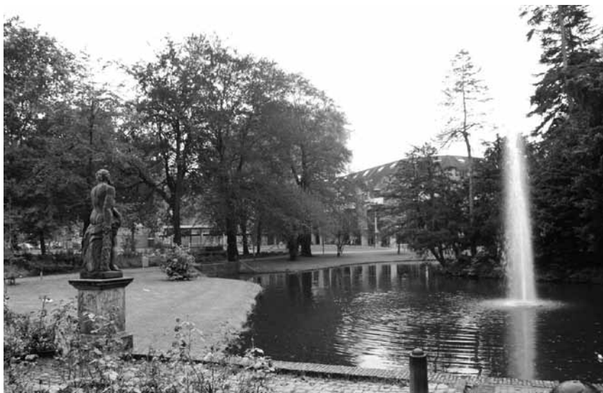
Gezicht over de vijver in de richting van het pand Markt 54. Door de bouw van het complex Marktstede is de relatie tussen huis en tuin verloren gegaan.

verbouwingen dan ook nauwelijks nodig. Een blik op de tekeningen geeft een idee van het nieuwe gebruik. Betrad men het huis dan was de eerste ruimte die men rechts passeerde, de voormalige eetkamer welke ingericht werd als afdeling Burgerlijke Stand en Bevolking. De aangrenzende schildertijenzaal werd herbestemd tot ondertrouw- en trouwkamer, de herenkamer als reserve vergaderzaal.