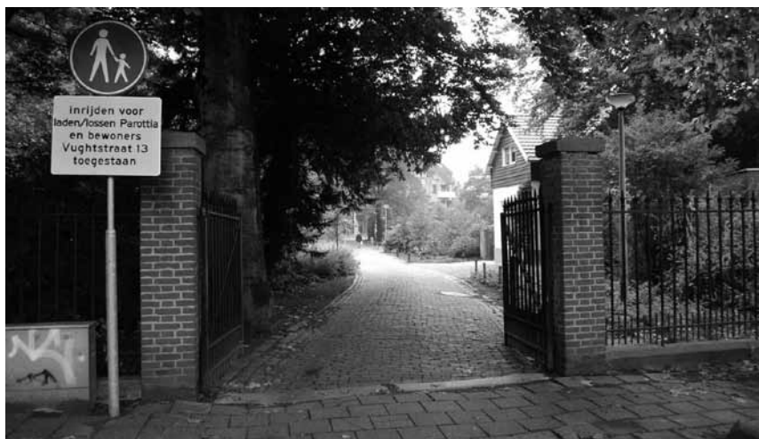
De oude toegangslaan vanuit de Vughtstraat die leidde naar de achterdeur van Markt 54. Rechts de voormalige tuinmanswoning.

Evenals het huis werden ook de tuinen aangepakt. Het middendeel van