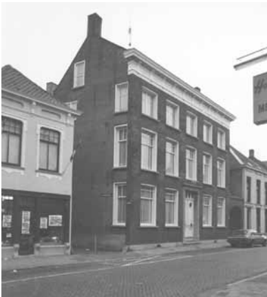
Raadhuisstraat 45.