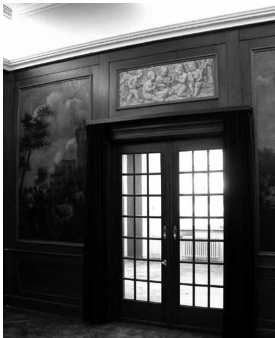
De doorgang van de schilderijzaal naar de eetkamer. Aan weerszijden van de deur geschilderde landschappen in lambrisering en lijstwerk. Boven de dubbele deur een zogenaamde grisaille met musicerende engeltjes.

Op de eerste etage werd deze plattegrond voor een groot deel herhaald. Beklom men de statige trap, dan kwam men op de ruime bovenhal die hetzelfde verloop had als de hal beneden. In het verlengde hiervan, boven het tochtportaal van de hoofdentree, bevond zich de zogeheten 'kleine logeerkamer'. Vanuit deze ruimte was het balkon aan de voorzijde van het huis bereikbaar. Aan weerszijden hiervan bevonden zich voorkamers, waarvan de linkerkamer als 'grote logeerkamer' werd bestempeld en de rechtervoorkamers door het aanbrengen van dubbele deuren tot 'boven-suite' werden verbouwd. Het hier aanwezige 'enfilade-effect' dat zoals eerder geschetst dateerde van de verbouwing in 1892, werd bij de verbouwing van 1929 door het dichtmetselen van de tussendeuren weggenomen.