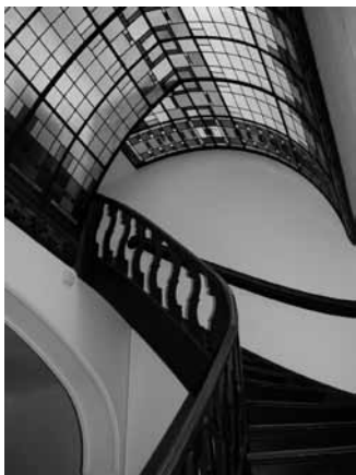
Detail van het trappenhuis met de zoldertrap en daarboven de lichtkap van glas-in-lood.

Deze ruimten waren grotendeels anders afgewerkt dan dat nu nog te zien is in de huidige situatie. Die is immers voor een groot deel pas in 1929 tot stand gekomen. Ook de trap en de keuken zullen er ten tijde van de bouw anders hebben uitgezien, maar deze zijn niet wezenlijk verplaatst binnen het pand. Dit heeft hoogstwaarschijnlijk te maken met lastig verplaatsbare zaken als waterleiding en de ontsluiting van de kelder.