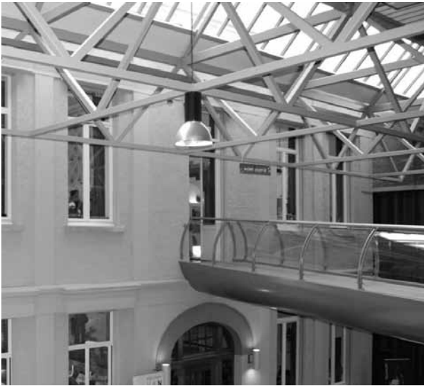
De achtergevel van het pand Markt 54 zoals deze tegenwoordig zichtbaar is vanuit de hal van de bibliotheek.