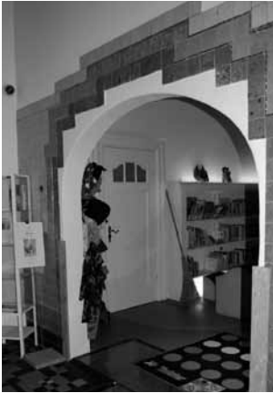
Bij de restauratie in 2007 werden de betegelde wand en het verzonken marmeren bad teruggevonden. Deze zijn zichtbaar geïntegreerd in het interieur van de bibliotheek.

Aan de achterzijde werd boven de zaal en de herenkamer de slaapkamer van de echtelieden Van Gilse gerealiseerd. Dit werd een enorme ruimte met spiegelkast en een doorgang met suitedeuren naar de aangrenzende kastenkamer en 'boven-suite'. Aanvankelijk lag deze kamer precies boven de schilderijenzaal. Bij de verbouwing werd de ruimte een kwartslag gedraaid, zodat de lange zijde aan de tuinkant kwam te liggen en daarmee de kamer een stuk lichter werd. Het gedeelte van de slaapkamer dat hiermee kwam te vervallen werd ingericht als kastenkamer en met een boog verbonden aan de bovenhal.