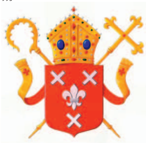
14. Officieel wapen van het bisdom Breda 1993