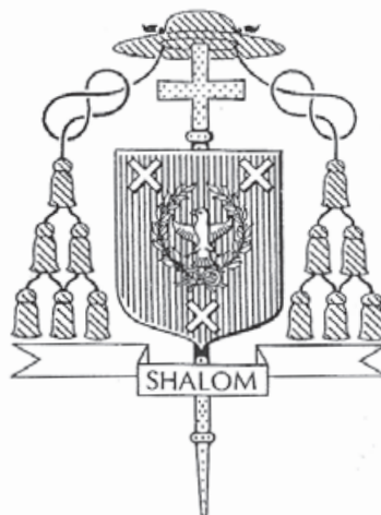
12. Wapen van bisschop Martinus Muskens, 1994