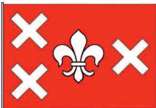
13. Vlag van het bisdom Breda, 1993