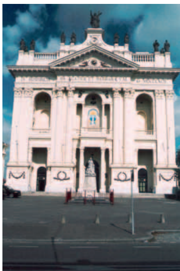
16. Voorgevel van de basiliek te Oudenbosch, 2007