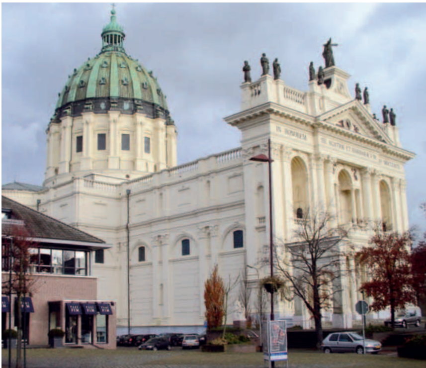
21. Met koepel en voorgevel domineert de basiliek van Oudenbosch de wijde omgeving en symboliseert op eigen wijze de historische band van de plaats met Rome