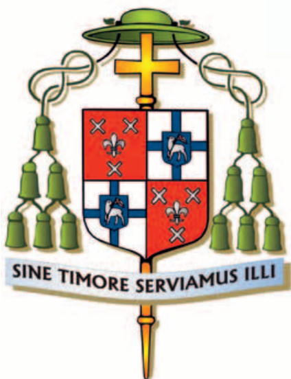
15. Wapen van bisschop Johannes van den Hende, 2006