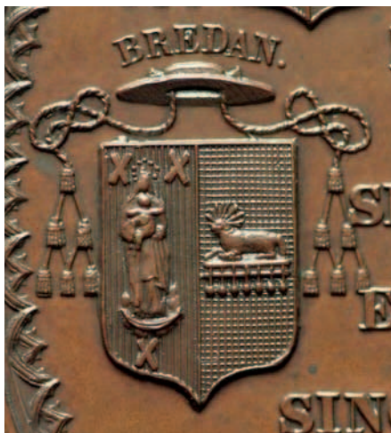
01. Gezamenlijk wapen van het bisdom van Breda en van bisschop Joh. van Hooijdonk. 1853.