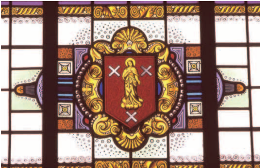
o6. Wapen van het bisdom van Breda, ca. 1930