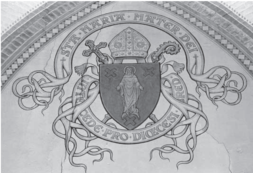
o8. Wapen van het bisdom Breda, eertijds in de voorhal van de vroegere Sint-Barbarakathedraal