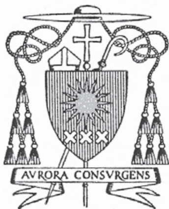
09. Wapen van bisschop Joseph Baeten, 1945