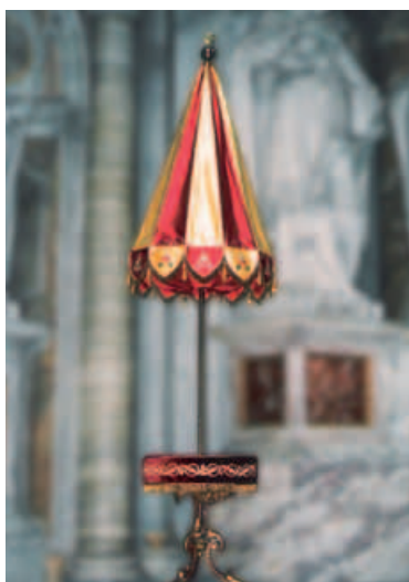
18. Conopeum of scherm van de basiliek van de heiligen Agatha en Barbara te Oudenbosch, 1912