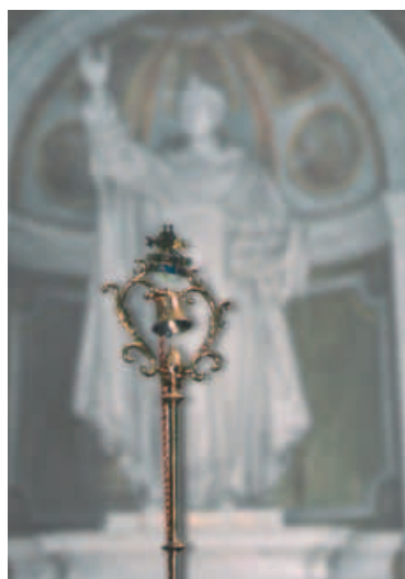
19. Tintinnabulum of klokstandaard van de basiliek te Oudenbosch, 1912 (Foto Rien Voermans, 2007)