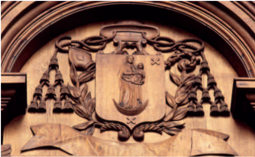
o7. Wapen van het bisdom van Breda 1868 (Dia 2007)