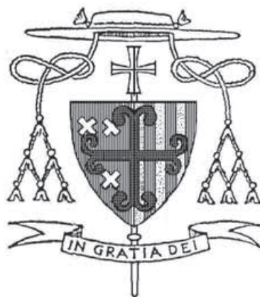
10. Wapen van bisschop Gerardus de Veth, 1962