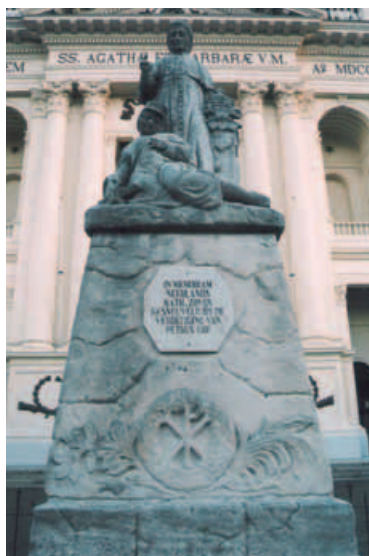
17. Standbeeld van paus Pius IX op het voorplein van de basiliek te Oudenbosch, onthuld in 1911 (2007)