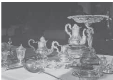
Een deel van de zilveren gebruiksvoorwerpen, die in 1949 werden geëxposeerd in het museum.

In 1950 werden twee tentoonstellingen georganiseerd. De eerste van dat jaar werd gehouden op 5, 6 en 7 mei en ging over Oude prenten uit de zestiende tot en met de achttiende eeuw . Ze waren afkomstig uit particulier bezit. Er waren tekeningen van onder meer Rembrandt, Lucas van Leijden en Albrecht Dürer. De tentoonstelling werd bezocht door 288 mensen. De andere expositie had als thema Oud tin en werd gehouden rond Kerstmis (24 en 26 december) 1950. De voorwerpen waren, zoals bij eerdere tentoonstellingen, afkomstig uit particulier bezit. 78 Genoemd werden gildenbekers, bier- en wijnkannen, miskelken en tinnen schalen. Ook waren er oude reclameaffiches tentoongesteld. Er kwamen echter maar 140 bezoekers op de expositie af. In dat jaar telde De Ghulden Roos in totaal 1.308 bezoekers, waarvan 839 betalende en 469 gratis. Geconstateerd werd een stijgende belangstelling van de schooljeugd voor het Roosendaalse museum (zie bijlage 1). 79