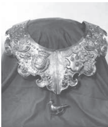
De zilveren schutterskraag van het Roosendaalse Sint Sebastiaansgilde uit 1611 in eigendom bij het Rijksmuseum in Amsterdam.

Maar al enkele weken eerder was het museum officieel geopend. Dat gebeurde op Hemelvaartsdag 21 mei 1936. Voorzitter en tevens museum-directeur J. Werz opende de bijeenkomst en schetste in het kort de voorgeschiedenis van de Stichting. 34 Hij bedankte vervolgens voor al de schenkingen en giften van voorwerpen. Met name was er dank voor het Rijksmuseum in Amsterdam, dat de bekende schutterskraag uit 1611