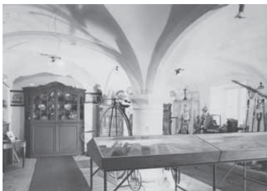
De benedenzaal (ook genoemd 'de zuilenzaal') in het oude raadhuis, waar het museum in 1936 begonnen is. Foto uit 1969.