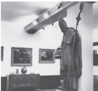
Interieur van het museum in de bovenzaal van het oude raadhuis in 1966. Op de voorgrond het beeld van Ambrosius, afkomstig uit de oude kerk van Nispen en in 1934 geschonken aan het museum.

De inrichting van de Ost-zaal zorgde er wel voor dat er opnieuw ruimtegebrek in het museum ontstond. Daarom werd besloten minder interessante voorwerpen op zolder te bergen. Toch bleef het stichtingsbestuur onder aanvoering van Johan Werz en René van Hasselt op zoek naar