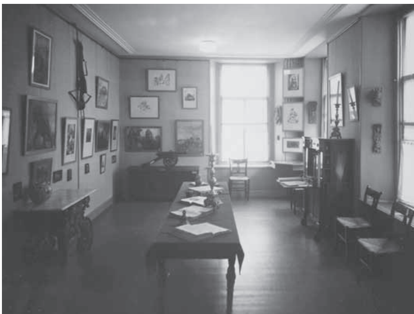
De Ost-zaal, vermoedelijk na de opening in 1937.

waardevolle voorwerpen die pasten bij de stads- en streekgeschiedenis en -folklore. 36