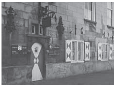
De ingang van het museum in het oude raadhuis in 1972.

Het regionale karakter van het jaarboek wordt nog benadrukt in het eerste artikel. Dat is van de hand van redacteur dr. A. Weijnen onder de titel Het land rond de Roosendaalsche Vliet . In deze bijdrage onderbouwt hij uitgebreid en gedetailleerd de keuze die de Stichting gemaakt heeft voor het werkgebied van Roosendaal en omgeving. Die regio beslaat de