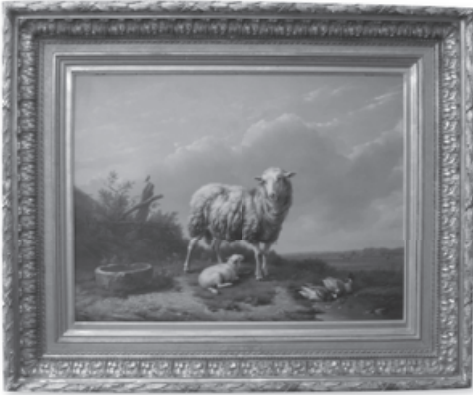
Schilderij van Eugène Verboeckhoven (1799-1881) behorende tot de negentien gerecupeerde schilderijen, toen genoemd Schaap en eenden (1849), nu aangeduid als Landschap met dieren. (Bruikleen Instituut Collectie Nederland.)

Bol hingen. Hun gezamenlijke waarde werd geschat op 7.500 gulden. Op de kamer van de burgemeester hing onder meer een sepia-tekening van Willem Maris en een kopie van Boerenkermis van Pieter Breughel. De verzameling Rijnlands steengoed was ondergebracht in het oude raadhuis. 75 Meer dan de verzameling goed opbergen was toen niet mogelijk, vanwege het feit dat het tribunaal nog steeds de meeste ruimten bezet hield.