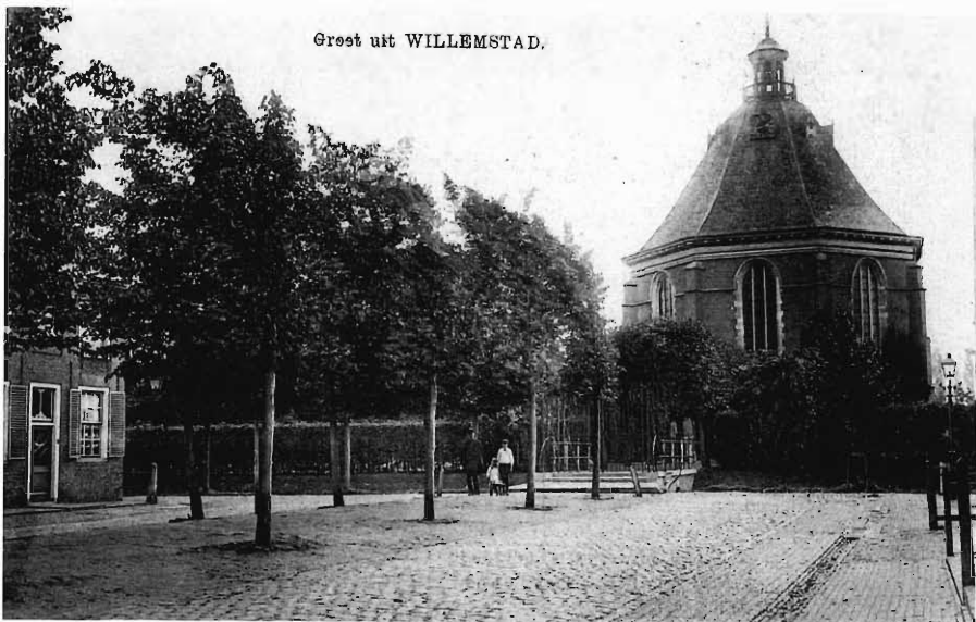
Opname omstreeks 1920.