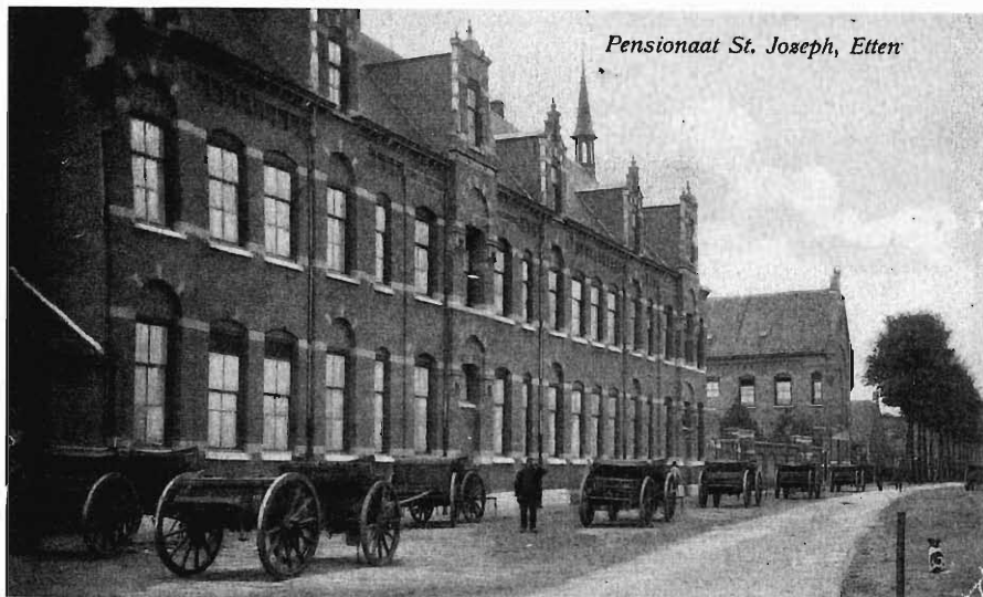
Opname uit 1915.

Met het gereedkomen van het nieuwe stads- dan wel winkelhart heeft het centrum van Etten-Leur een ware metamorfose of zoals tegenwoordig gezegd wordt, een 'extreme make-over' ondergaan. In Het centrumplan van Etten-Leur is de geschiedenis van het gebied vastgelegd in de vorm van een terugblik in een ver verleden, maar ook met herinneringen en overpeinzingen aan een recentere periode van allerlei min of meer betrokkenen tijdens de realisatie van het nieuwe hart.