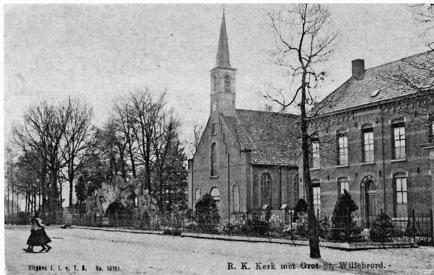
Opname uit 1920.