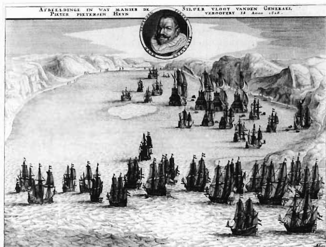
Verovering van de zilvervloot door Piet Hein in de Baai van Matanzas in 1628.