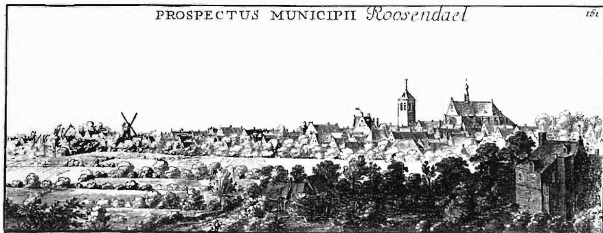
Gezicht op Roosendaal vanuit het zuid-oosten, 1655.

Volgens de overlevering ging Hendrick Lonck al op jeugdige leeftijd naar zee en klom hij snel op tot schipper. Hij wordt wel beschreven als een kleine, tamelijk dikke en humeurige man, maar dit lijkt niet meer te zijn dan een interpretatie op grond van zijn portret en gedrag op latere leeftijd. Er wordt ook gezegd dat hij erg op Roosendaal gesteld was en altijd tekende met de bijvoeging 'van Roosendaale'. Dat laatste is zeker niet waar, want hij zette meestal zijn handtekening zonder die toevoeging. Wel staat vast dat hij in de omgeving van zijn geboorteplaats boerderijen en land bezat. 3 Hij schijnt ook in Roosendaal al enige activiteit als scheepsreder te hebben ontplooid. Mogelijk werkte hij rond de eeuwwisseling voor de Nieuwe Brabantse Compagnie, een voorloper van de Verenigde Oost-Indische Compagnie (VOC), die in 1602 werd opgericht.