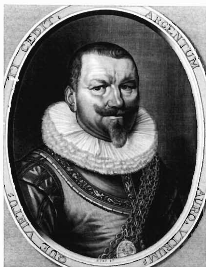
MAGNANIMO VIRO D. PETRO HEINO PETRIDE SOCIETATIS INDIAE OCCIDENTALIS PERMISSA A PROVINCIIS COFOBERATIS