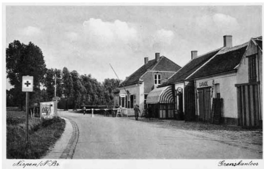
Opname uit 1935.