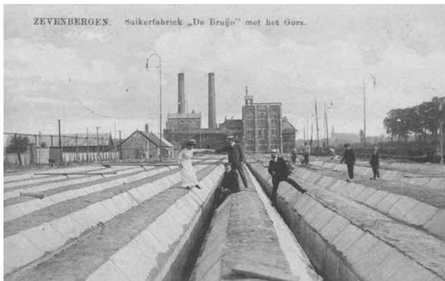
Opname uit 1912.