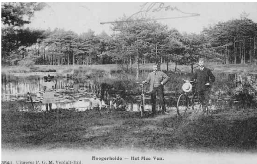
3541 Uitgever P. G. M. Verdult-Irill.

Van de hand van Louis Kessel is nummer 78: Over suiker en suikerfabrieken rondom Oudenbosch in de 19e eeuw . Het gedeelte over de Oudenbossche suikerfabrieken is vrij oppervlakkig en beslaat nog niet de helft van de publicatie. In 1918 werd te Oudenbosch de laatste campagne gedraaid. Met een korte beschrijving