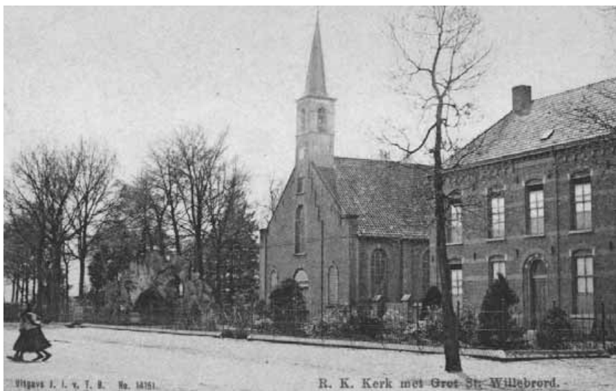
Opname uit 1907.

Kroniek van Steenbergem. Viermaandelijks uitgave van C. Slokkers.