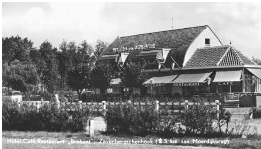
Opname uit 1960.