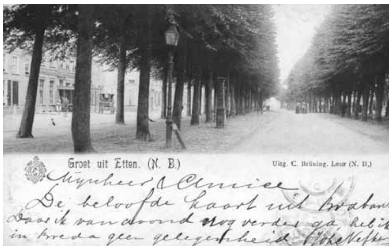
Opname uit 1901. Prentbriefkaartencollectie Geert de Bruijn, St. Willebrord.

In zijn serie De Geschiedenis van Bergen op Zoom is drs. G.A. Huijbregts inmiddels toe aan aflevering XXII: La Ville de Bergen op Zoom 1810-1814 . In januari 1810 voegde keizer Napoleon het gedeelte van het Koninkrijk Holland ten zuiden van de Waal toe aan zijn Franse keizerrijk. Later in het jaar zou de rest van Holland volgen. In december 1813 verlieten Franse legers bijna geheel West-Brabant. Slechts in één plaats hielden zij stand: Bergen op Zoom. Engelse mariniers begonnen daarop een beleg in naam van de uit Engeland teruggekeerde Souvereine (en latere koning) Vorst Willem I. In de nacht van 8 op 9 maart 1814 werd de stad aangevalen, uiteindelijk zonder succes. Steeds verder in het nauw gedreven trad de Franse