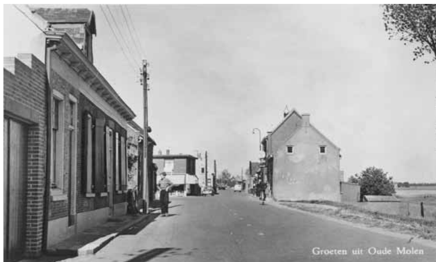
Opname uit 1958.

van Cees zijn herinneringen in woord en beeld verslag.