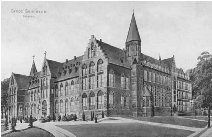
Opname uit 1907.

actualiteit lopen nog te zeer in elkaar over. Gekozen is daarom voor een Epiloog, waarin enkele grote lijnen, toegespitst op het beleid van de bisschop, getrokken worden.