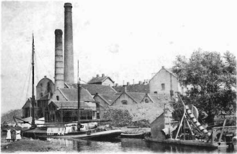
LEUR (Zwartenberg) Suikerfabriek van Ereda, Dolk & van Voss