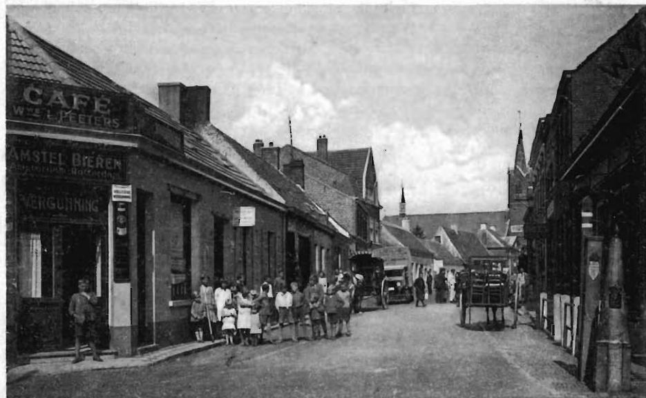
270. Putte N. B. Belgisch-Hollandsche Grens