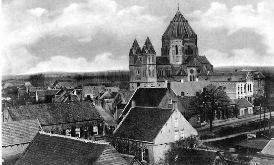
Prentbriefkaartencollectie Geert de Bruijn, St. Willebrord: opname uit 1915