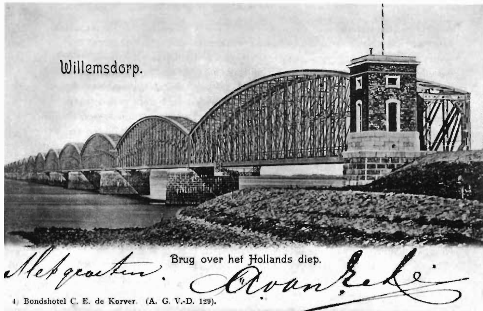
opname uit 1900

beschrijft de hoogtepunten van het Welbergse schoolkoor gedurende zijn bestaan van 1966 tot 1988. In Rederijderskamer 'Festina Lente' worden enkele in de negentiende eeuw opgerichte culturele gezelschappen voor het voetlicht gehaald. 150 jaar geleden werd Het liefdegesticht door de zusters penitenten-recollectieven in Steenberg opgericht. Reden om daar enige aandacht aan te schenken