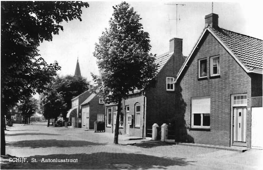
Prentbriefkaartencollectie gemeentearchief Rucphen: opname uit 1960