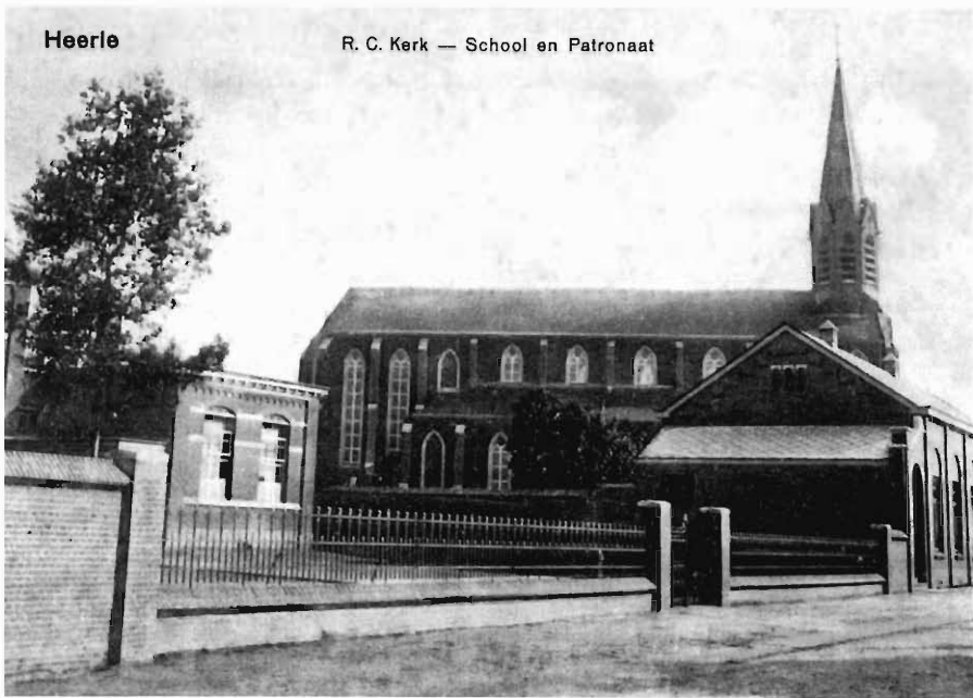
Prentbriefkaartencollectie Geert de Bruijn, St. Willebrord: opname uit 1918

cueerd. Doorbraak van dijken, verdwenen boerderijen, hulp van militairen, verdronken mensen. Gevoelig en doorleefd. Ook het tweede nummer van 2003 staat weer geheel in het teken van de watersnood. Het vorige nummer en de tentoonstelling hadden zoveel reacties opgeroepen, dat het de redactie terecht goed leek ook deze voor het nageslacht vast te leggen.