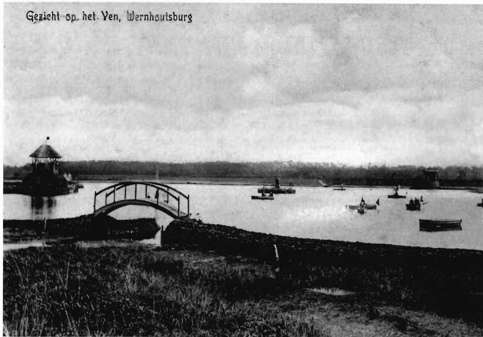
Prentbriefkaartencollectie Geert de Bruijn, St. Willebrord: opname uit 1908

hulp van onderzoek in archieven en kranten en van geïnterviewde mensen Stapvoets door Moerstraten gedaan. Ook hier blijkt weer dat kleine gemeenschappen hun eigen geschiedenis schrijven, die de moeite waard is om opgeschreven te worden. Deze uitgave is ook afzonderlijk uitgegeven door de 'Stichting Dorpsfeesten Moerstraten'.