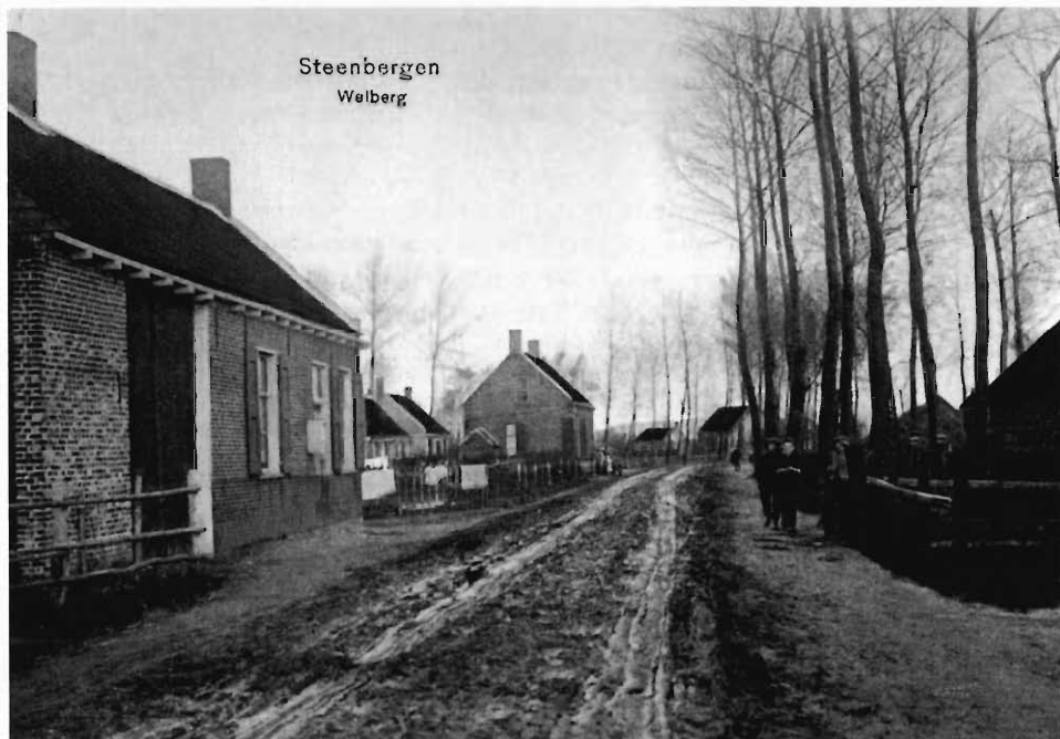
Prentbriefkaartencollectie Geert de Bruijn, St. Willebrord: opname uit 1908

de brochures Heilig Kruiskerk , de eerste echte moderne kerk in het bisdom Breda, gebouwd in de jaren zestig van de vorige eeuw, en De Sint Jan , gebouwd in 1839 en in het voorjaar van 2003 onttrokken aan de eredienst. Al in 2001 verschenen, maar ik kreeg het nu pas onder ogen: Leven en overleven , geschreven door de uit Roosendaal afkomstige Wim van der Horst over zijn ervaringen als verzetsstrijder en lid van de illegaliteit.