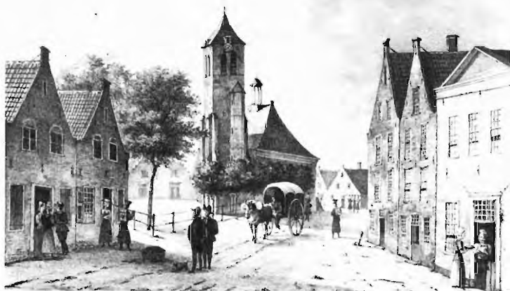
De Bloemenmarkt te Roosendaal, 1831 (Naar een tekening van M. van Straten. Coll. Noordbrabants Museum 's-Hertogenbosch)

Behalve naar de differentiatie in de beroepen is het de moeite waard te kijken of er in 1844 bestuurders deel uitmaakten van de financiële bovenlaag, en zo ja hoeveel dat er dan waren.