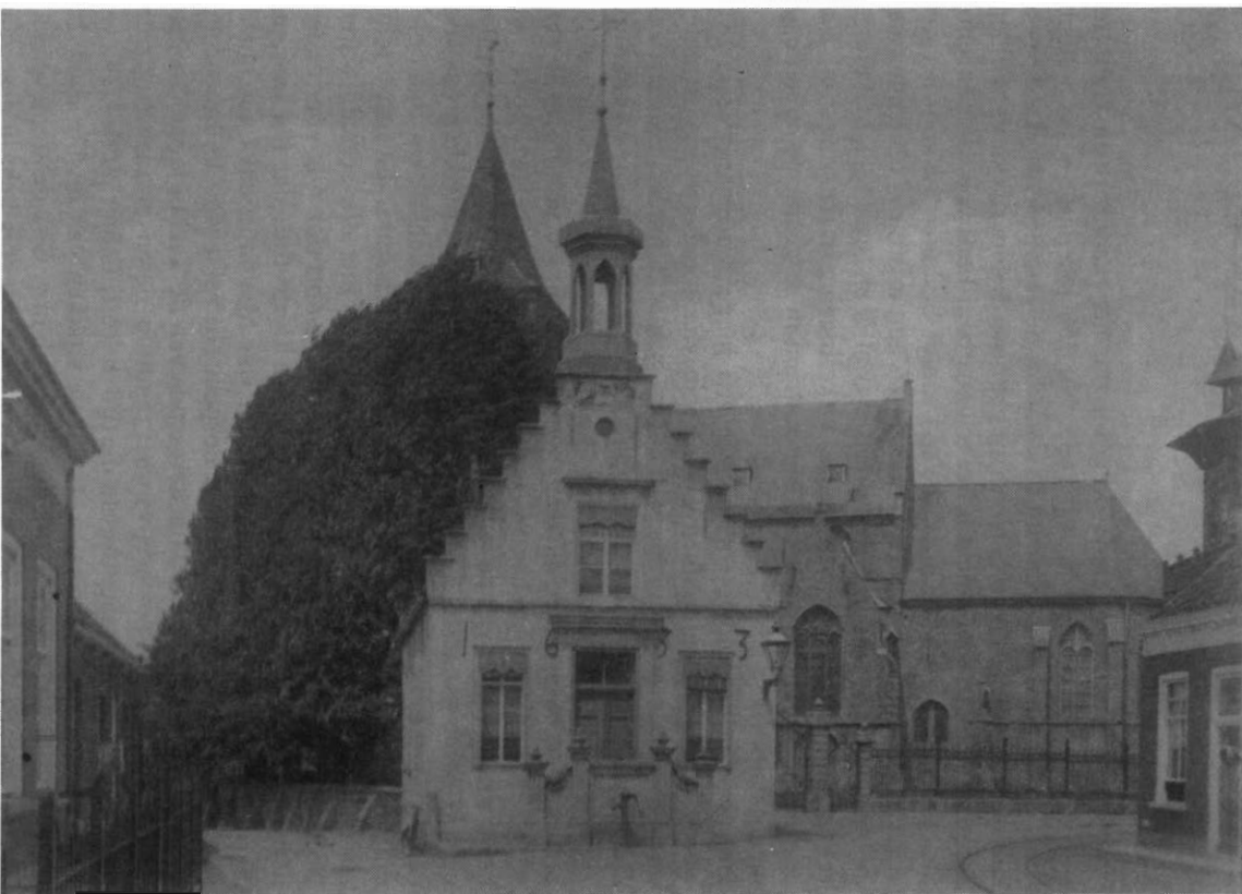
Voorgevel van gemeentehuis zoals die bestond van 1875 tot 1917. Opname ca. 1910.