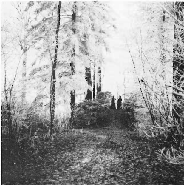
23-I-1908: Sterrebos: Konijnenberg.