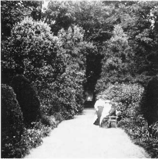
12-VII-1907: Sterrebos: Ingang der Grote Beukendreef.