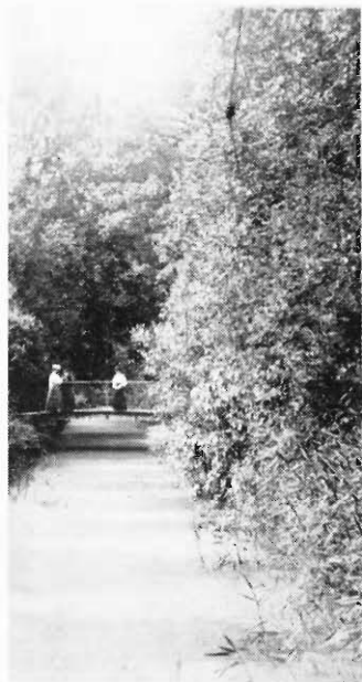
Brug over de Binnenvijver.