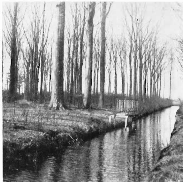
14-IV-1907: Sterrebos: N.O. Hoek met draaibrug.