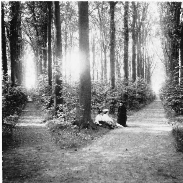
12-VII-1907: Sterrebos: Twee zijlanen.