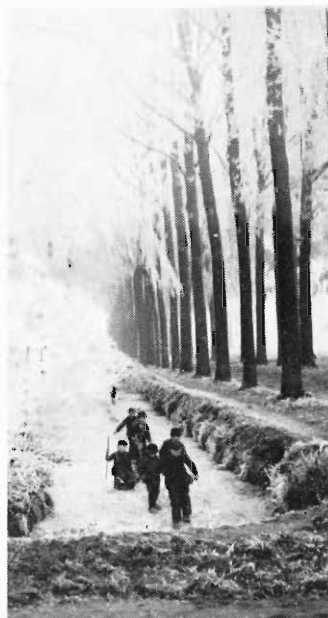
: Z.O. hoek IJsvermaak.