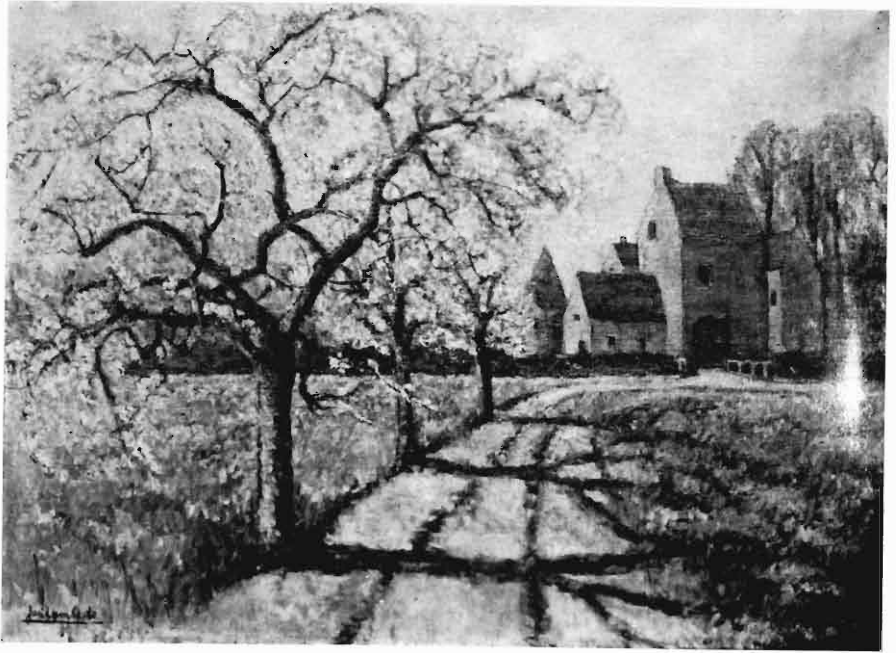
De oude pastorie van Nispen naar een schilderstuk van de kunstenaar J. Lamberts te Bilthoven.