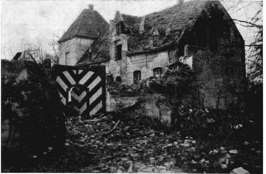
De oude pastorie na de oorlog 1940—'45.

steeds niet gerestaureerd werd, hoop ik met de beschrijving van de geschiedenis ervan te bereiken, dat meer aandacht aan dat monument geschonken zal worden en dat de Belgische dienst voor monumentenzorg binnen afzienbare tijd, het gebouw weer in haar oude luister zal herstellen. Is dit de moeite waard? Zeer zeker, want we hebben hier te doen met een landgoed waarvan reeds sprake is in 1157. In die tijd schenken Arnold van Brabant en zijn zoon aan de Abdij van Tongerlo „zeker vrij goed hetwelk zij, bij recht van erfenis vanwege hunne ouders, bezaten”. Door deze schenking gingen de rechten aan deze grond verbonden, over aan de Abdij van Tongerlo. Door latere aankopen en schenkingen werden deze bezittingen nog omvangrijker en op 28 Januari 1300 bevestigde de hertog van Brabant de rechten van de Abdij. Wie de eerste bewoners waren van dit kleine slot is moeilijk te vertellen, wel wordt er in een oud handschrift vermeld, dat hier een jachthuis van de hertogen van Brabant stond. In de volksmond gaat nog altijd het verhaal dat er in de kelder ovens waren waarin het brood voor de jachthonden gebakken werd.