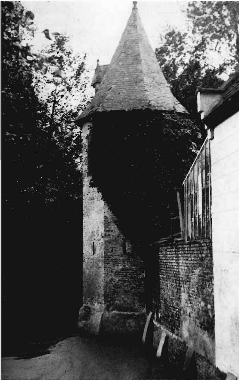
Het fraaie hoektorentje, een der oudste delen van de voormalige pastorie.