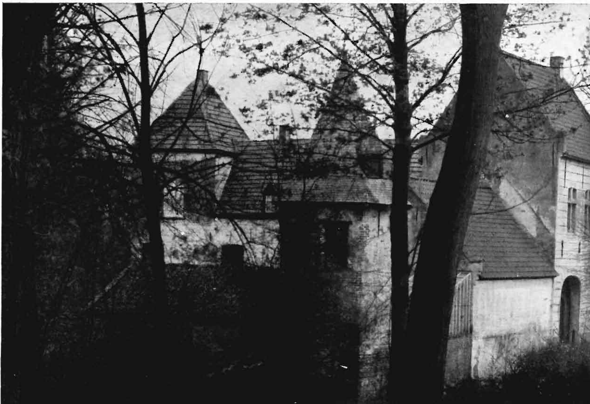
Het oude landgoed aan de Essendonkstraat.